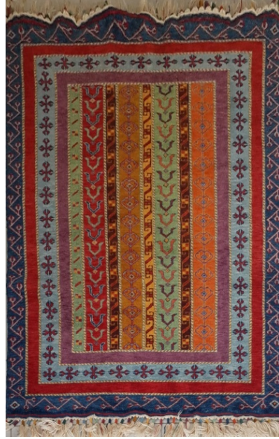
Şekil 17. Şal Deseni (Gördes Merkez-2014)