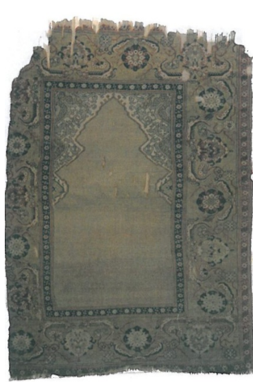
Şekil 9. Türk İslam Eserleri Müzesi’nde Bulunan TIEM 376 Envanter Numaralı 17. yy’a Ait Mihraplı Gördes Halısı (Anonim, 2009)

Marpuçlu Gördes: Mihrabı iki yanında sütunların uzandığı halılara Marpuçlu Gördes, Sütunlu Gördes ya da Direkli Gördes adı verilir. Osmanlı Saray Halılarının özelliğini taşıyan bu halılarda sütunların uçlarında stilize bitkisel motifler yer almaktadır (Aslanapa, 1987:156; Aslanapa, 1993:132; Bozkurt, 1997:259; Deniz, 1986:14; Deniz, 2000:108; Görgünay, 1977:173; Öztürk ve Aydın, 1994:30) (Şekil 10).