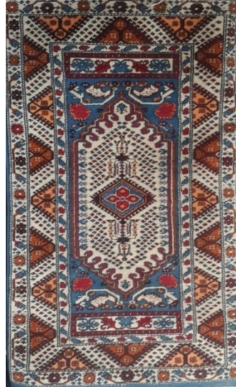
Şekil 12. Kız Gördes (Gördes-Merkez, Güneşli Mahallesi-2014)

Bitkisel boya ile elde edilen renkler pastel renk ve tonlarda olmakta, yapay boyalar ise parlak renkler vermektedir. Günümüzde kullanılan renklerin bir kısmı geleneksel renkler olmasına rağmen yapay boyaların kullanılması ile elde edilen renkler canlı oldukları için dokumada renklerin birbirleri arasındaki uyumu geleneksel halılarda olduğu gibi olmamaktadır. Ancak ticari amaçlı dokunan bu halılar, tüketici tarafından tercih edilmektedir. Tüketici tercihlerinin bu yönde olması da geleneksel renklerdeki değişimin hızlanmasının önemli bir nedenidir. Şekil 12'de son yıllarda dokunmuş bir Kız Gördes halısı ve kullanılan renkler görülmektedir. Dokumada beyaz ve kahverengi ile beraber turuncu, kırmızı ve mavinin canlı tonları yer almaktadır.