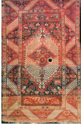
Şekil 6. Antalya Müzesi'nde Bulunan 1.56.75 Envanter Numaralı 18. yy'a Ait Kız Gördes Halısı (Anonim, 1992a)

1999:59; Bozkurt, 1997:259; Deniz, 1986:14; Deniz, 2000:38, 108; Görgünay, 1977:173; Öztürk ve Aydın, 1994:30) (Şekil 6).