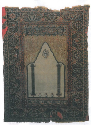
Şekil 10. Türk İslam Eserleri Müzesi'nde Bulunan TiEM 806 Envanter Numaralı 19. yy'a ait Marpuçlu (Sütunlu) Gördes Halısı (Anonim2009)

Elmalı Gördes: Ana bordürlerinde üç ayrı yöne bakan ve bir dalla birbirine bağlı bitkisel karakterli motif taşıyan namazlıklara verilen isimdir (Öztürk ve Aydın, 1994:30) (Şekil 11).