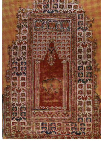
Şekil 8. Türk İslam Eserleri Müzesi’nde Bulunan 17. yy’a ait Avizeli Gördes Halısı (Anonim, 1992a)

Gördes” denir (Şekil 8). Kandilli Gördes halılarında kandilin yer almadığı ve mihrap zeminin düz renk olarak dokunduğu örneklere ise “Mihraplı Gördes” denir (Bayraktaroğlu, 1999:60; Bozkurt, 1997:259; Deniz, 2000:108; Leloğlu-Ünal, 1999:531) (Şekil 9).