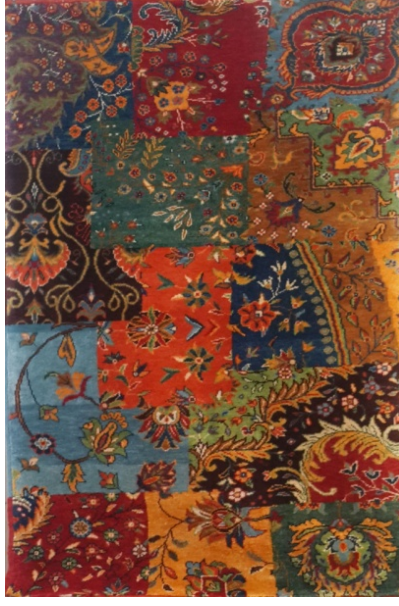
Şekil 16. Kirkyama Deseni (Gördes Merkez-2014)