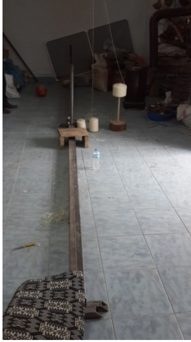
Şekil 2. Çözüme Aleti (Gördes Merkez Güneşli Mahallesi-2014)

Çözüme işleminden önce dokunacak olan halının boyutları belirlenir. Belirlenen boyuta göre çözüme aleti ayarlanır. Çözüme işlemi iki ya da üç kişi ile yapılabilir. Bir kişi çözüme aletinin iki demir borusu arasında çözüme ipliği ile sekiz rakamı yapacak şekilde gidip, dönerek ipliği sarar ve diğer kişiler de çözüme ipliğinin başına zincir atarak bağlar. Bu işlem bittikten sonra çözüme aletinden çıkarılan ve iki başına ince demir çubuk geçirilen çözüme ipliği iki kişi yardımı ile gerginleştirilir. Daha sonra hazırlanan çözüme ipliğinin tezgaha geçirilebilmesi için çubuklar alt ve üst leventlere yerleştirilir. Çözüme gerginliği tezgah üzerinde sıkıştırılmak sureti ile ayarlanır ve çözüme ve tezgaha geçirme işlemi tamamlanır.