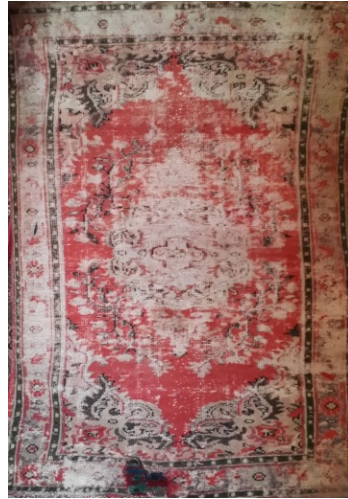
Şekil 7. Göbekli Gördes (Deliçoban Köyü-2014)

Göbekli Gördes: Göbekli Gördes'de de Kız Gördes'te olduğu gibi çift yönlü mihrapların üst kısımlarında dikdörtgen şekilli birer çerçeve yer alır. Bu çerçevelerin içi stilize ejder figürleri veya çiçek motifleri ile süslenmiştir (Anonim, 1990:13; Bozkurt, 1997:259; Deniz, 1986:14; Deniz, 2000:108 ) (Şekil 7).