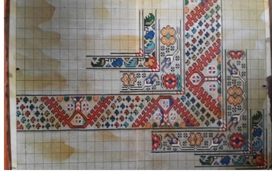
Şekil 1. Desen Örneği (Şeyhyayla Köyü-2014)

Gördes halısı dokuyan dokumacılar dokuma işlemine başlamadan önce özel olarak desen hazırlamakta, eski desen örneklerine veya önceden dokunmuş olan halıların motiflerine bakarak dokuma işlemini yapmaktadırlar. Yıllardır bu işi yapan dokumacıların büyük bir çoğunluğu da aynı motifleri sürekli dokudukları için ezberlemişlerdir. Bu nedenle herhangi bir örneğe bakmadan hafızalarından dokumaktadırlar. Şekil 1.'de dokumacıların kullandıkları bir desen örneği görülmektedir.