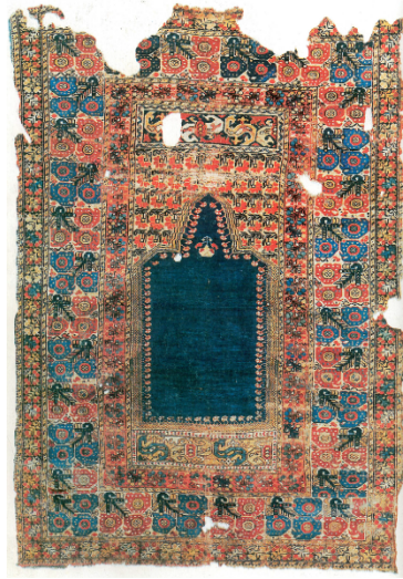
Şekil 11. Vakıflar Halı Müzesi'nde Bulunan E.65 Envanter Numaralı 19. yy'a Ait Elmalı Gördes Halısı (Anonim, 1992a)

Elmalı Gördes: Ana bordürlerinde üç ayrı yöne bakan ve bir dalla birbirine bağlı bitkisel karakterli motif taşıyan namazlıklara verilen isimdir (Öztürk ve Aydın, 1994:30) (Şekil 11).