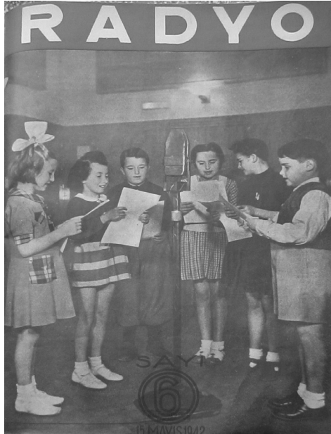
Resim III: Radyo Dergisi, 15 Mayıs 1942. “Radyo Çocuk Kulübü”

Çocuk Kulübü , aynı zamanda radyonun gelecekteki sanatçılarını hazırlama işlevi görüyordu. Bu programlarda yer alan çocukların önemli bir kısmı büyüdüklerinde spiker, ses sanatçısı, radyo tiyatrosu oyuncusu gibi farklı alanlarda radyoda yer alıyorlardı (Cankaya, 2003: 48).