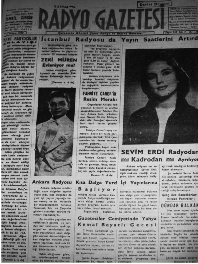
Resim IV: Radyo Gazetesi, 11 Mayıs 1960.

muştur (Eryılmaz, 2005: 92). Radyo sınavlarının yapıldığı zamanlar radyoya girebilmek için insanlar canla başla uğraşmaktadır. Radyo ayrı bir masal dünyası olarak insanlara sunulmaktadır.