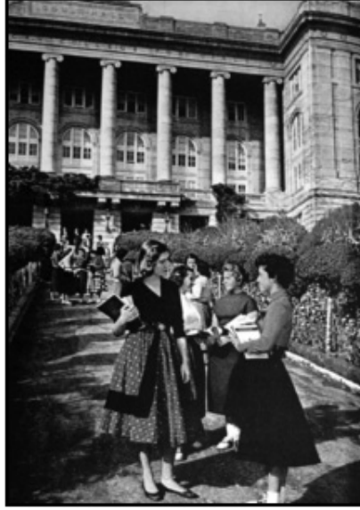
Fotoğraf 4 Amerikan Kız Koleji Türk kadınına batılı eğitimi getirdi (Ağustos 1951: 170).

Harem kadını hizmet eden, modern kadın – fotoğraftaki modern kadın göstergeleri başın açık olması, kısa kollu giysiler içinde olması ve etek giymesi – ise hizmet edilen olarak gösterilmiştir.