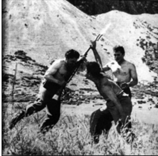
Fotoğraf 8 Türkler’e malzeme ve eğitim konusunda yardım etmek için ABD 1250 JAMMAT (Joint American Military Mission for Aid Turkey) uzmanı görevlendirdi. Alan kamplarında ve özel eğitim okullarında modern savaş teknikleri öğrenmelerine yardım ediyor. Kore’deki Türk Tugayı, milletin savaş kahramanlığını ispatladı. İlk Çin Komünist saldırısını takip eden kritik günlerde, bu askerlerin de pratik yaptığı el-ele taktikleri işe yaradı (Haziran 1952: 755).

Bu kahramanlık söylemine fotoğraflarda da rastlamak mümkündür. Fotoğrafların mizansenler olarak kurulduğu daha önce söylenmişti. Böylelikle gerek fotoğrafın içerisine yerleştirilen öğeler, gerekse çekim açılarıyla yazının söylemi desteklenmiştir. Türk askerlerini yüceltmek için alt açılar tercih edilmiş ya da aşağıdaki örnekte olduğu gibi bedensel aktiviteler kahramanlığın görsel kanıtları olarak kullanılmıştır. Fotoğraf alt yazılarıyla da bu kahramanlık ve komünizm karşıtlığı söylemi desteklenmiştir.