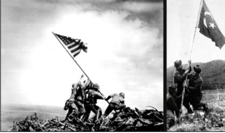
Fotoğraf 6 (solda) Joe Rosenthal "Iwo Jima'da Dikilen Bayrak", 1945.

Burada Amerikan halkına, ABD'nin dünyayı tehdit eden komünizme karşı mücadelesinde tek başına olmadığı ve savaşı "güçlü" müttefikleriyle birlikte sürdürdüğü mesajı verilmektedir.