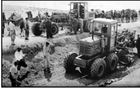
Fotoğraf 5 Marshall Planı'nın dolarları ve makineleri sayesinde yavaş deve ve eşeklerin yerini ülkenin en içi bölgelerindeki çiftlik ve madenleri Akdeniz, Ege ve Karadeniz'e bağlayan her türlü hava koşuluna uygun yollar aldı... ECA eğitilmiş Türkler, Anadolu yollarında Amerikan malzemeleriyle yeri oynatıyorlar (Ağustos 1951: 168).

İlerlemenin Yolunu Açıyor” başlıklı makalede, bir fotoğrafta modernleşmenin göstergesi olarak ön plana traktörler yerleştirilmiş, alt yazıda ise bu tarz bir modernleşmenin Amerikan yardımları sayesinde gerçekleşebildiğine dair vurgu yapılmıştır. Hemen karşı sayfadaki fotoğrafta ise köprü yapımında kullanılan eşekler gösterilerek fotoğrafın alt yazısında bunun eski-zaman yöntemi olduğu belirtilmiştir (Ağustos 1951: 168)