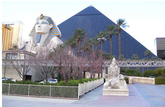
Görsel 20: Luxor Hotel&Casino, Las Vegas (Nevada/Amerika)