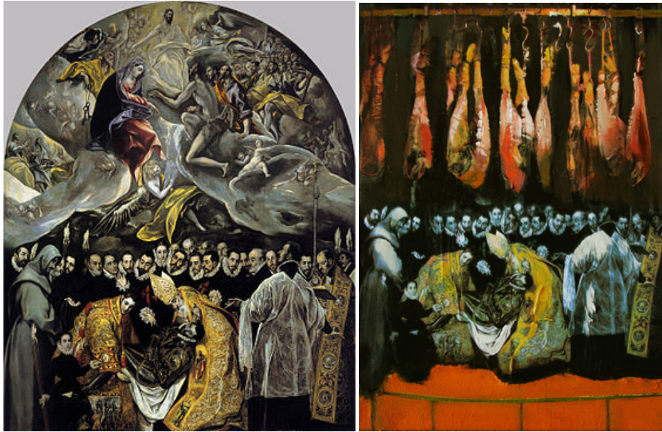
Görsel 3: El Greco, Orgaz Kontunun Gömülmesi, T.Ü.Y. 1586, İspanya. Görsel 4: Nicholas Chistiakov, Etkilerle Orgaz Kontunun Gömülmesi, Karışık Teknik, 2012.

Postmodernist teori pastiş gibi ifadelerle modern sanatın temel avant-garde özelliğine karşı çıkmış; postmodern teori kaynağını tarihten, parodi, pastiş yollarıyla eklektik öğeleri alarak oluşturmuştur. Modernizm ve estetik anlayışı olarak baktığımızda pastişe tam olarak zıt olan bir kavramın ortaya çıktığından söz edebiliriz. Modern zamanların sanatını tanımlayan Avant-Garde kavramı pastiş olanla tam olarak zıt bir özellik göstermektedir. Avant-garde sürekli olarak yeniyi inşa eden bir kavram olduğu bilinmektedir. Daha önce hiç yapılmamış, “ sunulmayanının sunulması ” şeklinde ifade edilen nosyon modern zamanların estetik önermesidir. Oysaki pastiş geçmişle günümüz sanatının bağlarını kuran, eski anlayış ve fikirlerin yeniyi uyarlanması diyebiliriz (Görsel 3-4). Şu durumda pastiş kavramının eklektik bir yapı içerisinde kullanılması günümüz sanat ve eserlerinin önemli yapı taşlarından birisini oluşturmaktadır.