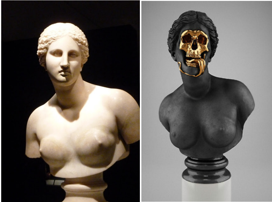
Görsel 5: Afrodit Büstü, M.Ö. 360 Roma Dönemi Kopyası.

Postmodern dönemde ortaya çıkan ve sanatta sınırların erimesi anlamına gelen; farklı sanat disiplinlerinin bir arada gerçekleştirildiği sanatsal faaliyetler postmodern sanatın öne çıkan özelliklerindedir. Çoğulcu anlayışın öne çıktığı, özellikle güzel sanatlarda görülen, taklit, ironi, pastiş(alıntılama), kolaj, asamblaj gibi tekniklerin kullanıldığı sanat eserleri yaratılmış ve bu eserlerin yeni orijinaler olduğu düşünülmüştür. Tarihsel bilincin gelişmesi ve eserlerde kullanılması modernizmin geleneksele karşı tutumuna ters düşecek nitelikte abartılmış, sanat eserlerinden herhangi bir nesnel ifade alınarak rahatlıkla başka eserlerde kullanılmıştır (Görsel 5-6).