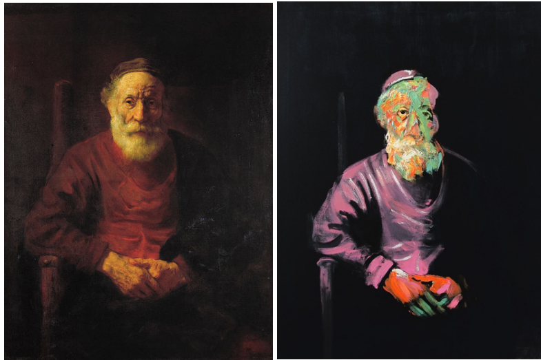
Görsel 9: Rembrandt, Yaşlı Adam, T.Ü.Y. 1654.