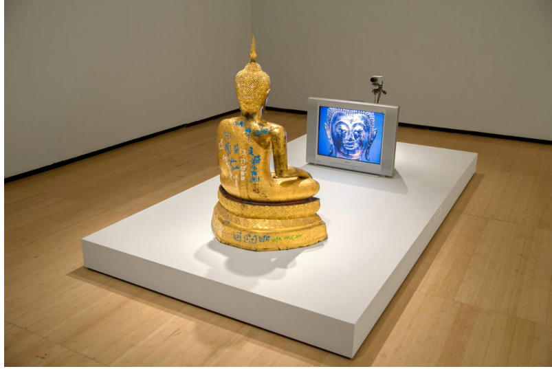
Görsel 2: Nam June Paik, Altın Buda, Karışık Materyal, 13x19x17inç, James Cohan Galerisi, New York

Fluxus, Happening ve Performans sanatları gibi-pastiş özellikler taşıdığını söylemek yanlış olmayacaktır. Nam June Paik (Görsel 2) veya Joseph Beuys gibi sanatçılar farklı kültürel özellikleri ve imgelemleri ikonografik olarak çalışmalarında kullandığı rahatlıkla eserlerinde gözlemlenebilir.