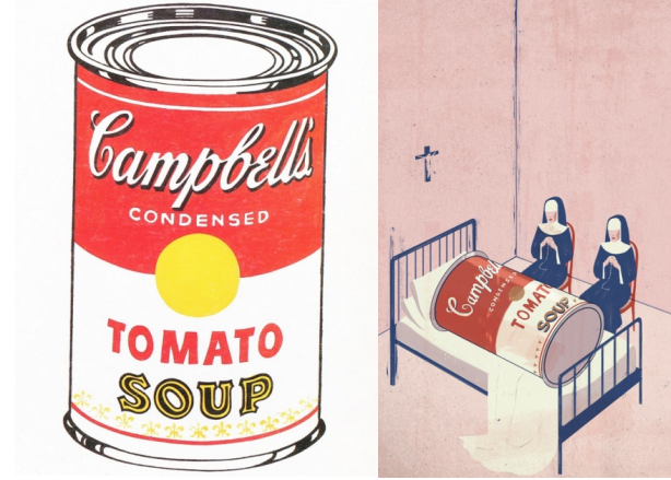
Görsel 13: Andy Warhol, Campbells Çorba Kutusu, T.Ü.Y. 1962.

üretmesinde önemli bir öge haline gelmiştir. Pastiş, farklı disiplinlerdeki içeriklerin bir arada kullanılmış hali olarak nitelenebilir ve bu şekilde ele alındığında pastiş birden fazla kaynaktan alınan, alıntılarının oluşturduğu bir bütündür denilebilir (Görsel 13-14).