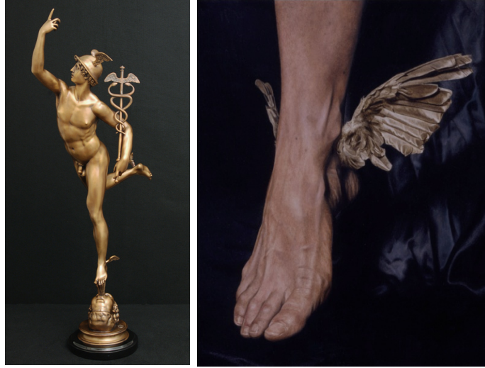
Görsel 7: Giovanni Bologna, Hermes Heykeli, Tunç, Floransa, Museo Nazionale del Bargello, 1567.

Günümüz sanatının tam olarak kökenine inmek neredeyse imkansız gibi görünmektedir. Eklektik bir sanat anlayışıyla çalışmalar yapan sanatçılar hiçbir tahakküm altına girmeden eserlerinde başka sanat ve kültürlerin değerlerini rahatlıkla kullanabilmişlerdir (Görsel 7-8-9-10). Bu bağlamda bakıldığında pastiş; fikirlerin ya da görüşlerin gelişi güzel, karmakarışık, darmadağınık, kolajı andırır biçimde bir araya getirerek oluşturdukları, kırk-yama (patch-work) olarak eski-yeni gibi olguları bünyesinde barındıran eklektik kompozisyonun bir elemanı olma niteliğindedir. Düzenliği, mantığı ve simetriyi yadsır; çelişki ve karşıtıktan hoşlanır (Rosenau, 1998:16).