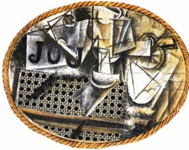
Görsel 1: Picasso, Bambu Sandalyeli Natürmort, 1911-12

Pastiş sadece günümüz postmodern zamanlarının sahip olduğu nitelikte bir sanatsal edim olmamıştır. Modern zamanların çağdaş sanat akımlarına bakıldığında pekala çoğul nesnelerin bir arada kullanıldığı sanat eserlerine rastlamak mümkündür. Lyotard’ın meşhur sözleri aklımıza gelmektedir: “Bir yapıt eğer ilkin postmodernse modern olabilir.” Bu açıdan bakıldığında modern zamanların eser üretim/yaratım tekniklerinden olan “kolaj” postmodernizmde adı sürekli olarak anılan pastişe gönderme yapmaktadır. Picasso’nun yapmış olduğu kolajlar (Görsel 1) heterojen özellikli yapıtlardır ve dolayısıyla postmodernist sanat eserinin mayasını teşkil etmektedir (Yılmaz, 2006:345).