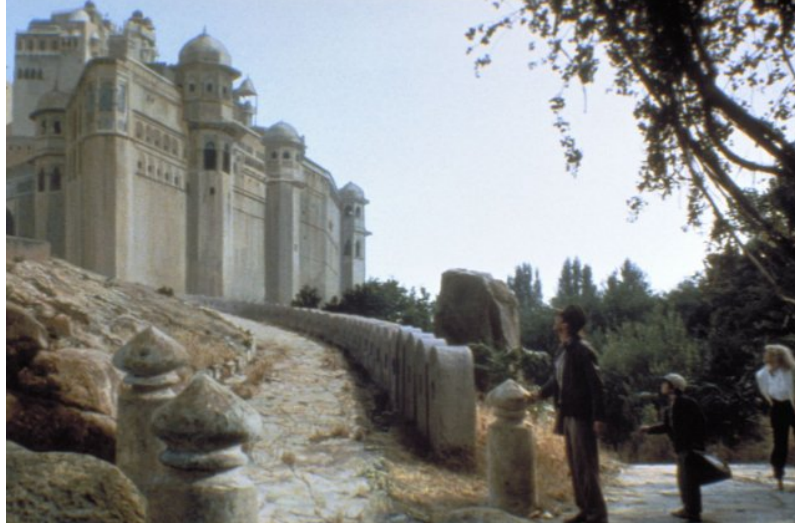
Görsel 16: Yönetmen: Steven Spielberg, İndiana Johns Serisi (Temple of Doom), 1984.

Pastiş, popüler kültürde daha fazla belirgin olarak karşımıza çıkmaktadır. George Lucas'ın 1930'ların bilim-kurgu serisi olan Star Wars , Flash Gordon'dan etkilendiği düşünülür, Filmin jenerik kısmındaki kayan yazılan direkt olarak Flash Gordon'dan alıntılar yapılarak elde edilmiştir. Aynı şekilde Indiana Johns (Görsel 16) filmi gibi birçok film 1930'larda yapılan macera dizileri üzerine geliştirilerek günümüze kazandırılmıştır. Macera filmlerinde kullanılan birçok öğe; daha öncesinde tarihe karışmış, zamanın küllerinden yeniden doğmuştur. Macera filmlerinde kullanılan tapınak, gömülü hazineler gibi öğeler kendilerinden önceki dönemlere ve kültürüne işaret eden, alıntılama öğeleri taşıyan kavramlardır.