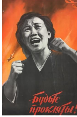
Resim 3. Tepki Konulu Propaganda Posterleri

Tepki konulu propaganda posterleri, Koretsky Victor Borisovich tarafından 1965 yılından hazırlanmıştır. Posterin sağ altında Lanet olsun! (Будьте прокляты!) yazısı bulunmaktadır. Görüntüsel gösterge boyutunda incelendiğinde posterde iki elini yumruk yapan ve ağlayan bir kadın resmedilmektedir. Arka plan da üstünde “US” yazısı bulunan uçaklar yer almaktadır. Posterin fonun da ise alev rengini andıran tonlar kullanılmaktadır. Bu açıdan posterde kadının arkasında yangın olduğuna yönelik algı meydana gelmektedir.