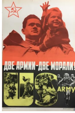
Resim 5. Ahlak Konulu Propaganda Posteri