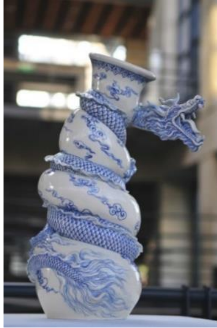
Görsel 7: Jonson Tsang, A Painful Pot,2013

Hon Kong doğumlu seramik sanatçısı, çoğunlukla sürrealist hayal gücünün eşlik ettiği seramik heykel çalışmalarıyla tanınmaktadır. Çalışmalarında mitolojik yer ve gök anlamlarını taşıyan ejderha figürünü sıkça kullanmaktadır. Ejderha figürünü en güzel yansıttığı çalışması 2013 yılında tasarladığı 'A Painful Pot' isimli seramik vazosudur. Çalışmasında beyaz porselen bünyeyi tercih eden sanatçı, bu eserinde vazoyu mavi renk tonlarındaki ejderha figürü ile adeta yılanı andıran biçimde sararak, formu daraltmıştır. Bu şekilde vazo, mavi renk ejderhanın kıvrımları ile şişkin bir görünüm almıştır. Vazoyu pençeleriyle tutan ejderhanın ağız kısmı açık, dişleri keskin biçimde tasvir edilmiştir (Görsel 7). Sanatçının bitkisel bordürlü seramik tabak çalışmalarında ise ejderha figürü tabağın ortasından fıskırır biçimde tasarlanmıştır (Görsel 8).