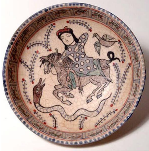
Görsel 2: Selçuklu seramik tabaklarında ejder ve av sahnesi, 12-13. yüzyıl

Seramik yüzeyler üzerinde dekor olarak kullanılan ejderha figürleri bazen durağan, bazen ise av mücadelesinde karşımıza çıkmaktadır. Ejderhanın ay ve güneş tanrılarının mücadelesini simgelediği bilinmektedir. 12. ve 13. yüzyıl Türk seramik sanatında ejderha ve insan ikilisinin hayvan mücadele sahnelerinin ana motiflerindedir. Özellikle tabak dekorlarındaki av sahnelerinde sultan ejderhayı avlar biçimindedir. Selçuklu seramik sanatında 'evren' adını alan ejderhanın vücudu helezon yılan biçimindedir. Seramik tabak uygulamalarda ayaksız, rölyef kabartma yüzeylerde ise iki ayaklı olarak tasvir edilmiştir. Ayaklar daima profilden görülmemektedir. Genellikle ejderhalar yılan biçiminde, boynuzsuz, ayaksız, kanatsız pulsuz biçimindedir (Görsel 2). Benzer örneği Pençikent resimlerinde de görülen ejderhalar sularında yaşayan ejderhayı temsil etmektedir (Şensilay, 2006:14).