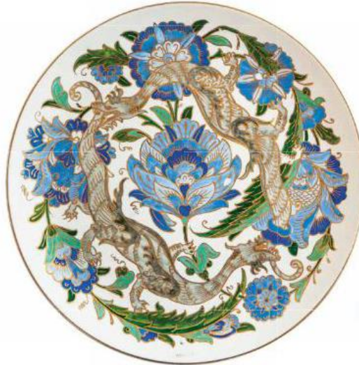
Görsel 10: Ejderli porselen tabak, sırüstü, 25 cm