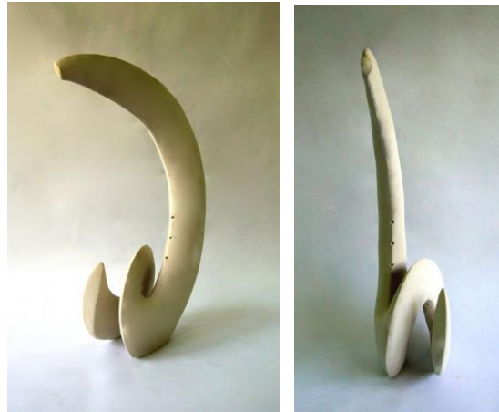
Görsel 6: Nizam Orçun Önal, Ejderha, 75cm

“Ejder” isimli seramik çalışmasında şamotlu kil tercih eden sanatçı, el ile şekillendirdiği form üzerine döküm kilinden astar sürerek, pürüzsüz bir biçimde işlemiştir. Sanatçı, spiral dönüş kıvrımları ile seramik yüzeye, ejderhanın anlam ve kuvvetini yüklemeye çalışmıştır. 75 cm boyutundaki seramik heykel çalışmasında sanatçı, ejderha ve ejderhanın kökeni olan yılanı simgelemektedir (Görsel 6).