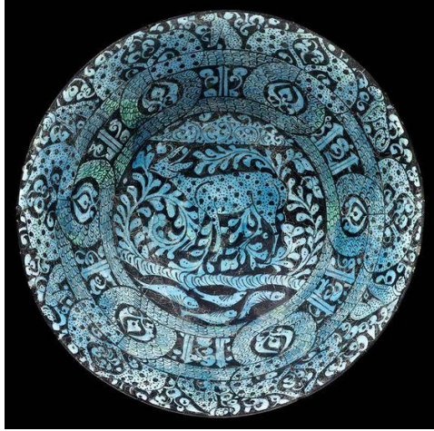
Görsel 3: 12-13. yüzyıl Selçuklu dönemine ait seramik tabak

“Hayvan figürlerinin sembolik anlamlarına bakıldığında, çeşitli hayvanların kutsal sayılması ve vahşi hayvanlara duyulan korku, onlardan korunma ihtiyacını ve insanların hayvanlar gibi kuvvetli olabilme isteğini ortaya çıkartmış olduğu görülmektedir (Çoruhlu, 2000: 166)”. Bu nedenden dolayı hayvan mücadele sahneleri Anadolu seramik-sanatında tercih edilen konular arasındadır.