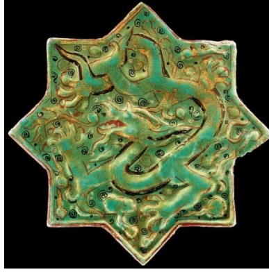
Görsel 5: Minai tekniği ile yapılmış evren motifli kabartma karo, Selçuklu dönemi, 1275