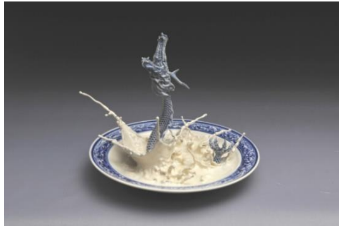
Görsel 8: Jonson Tsang, A Plate 2013