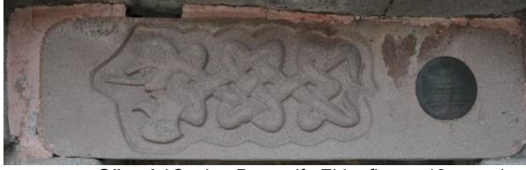
Görsel 1 Çankırı Darüşşifa Ejder figürü, 12. yüzyıl

insanları iyileştiren bir sembol olarak görülmektedir (Görsel 1).