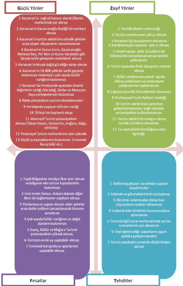
Şekil 1: Karaman İli Turizmi GZFT Analizi

Karaman ili yabancı turist profilinde tablo-5'e göre göze çarpan ülkeler; Almanya, İtalya, Hollanda, Avusturya, Fransa, Makedonya, ABD ve Çin olarak sıralanmaktadır. İnanç turizmi kapsamında Derbe, Karadağ, Aktekke Cami ve Yunus Emre Camiyi günübirlik ziyaret eden yerli ve yabancı turistler ile, tarih ve kültür turizmi kapsamında tur operatörleri tarafından Karaman'a getirilen özellikle Taşkale, Derbe ve Karadağ bölgesini ziyaret eden yerli ve yabancı turistler (Kore ve Japonlar haftada 4-5 defa olmak üzere Taşkale'ye) bu istatistiklere dahil edilmemiştir.