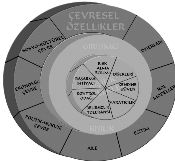
Şekil 1: Girişimci Kişiliği Etkileyen Çevresel ve Kişisel Özellikler

Girişimciliğin ortaya çıkışında kişiliğin mi, yoksa sosyal çevrenin mi daha etkili olduğu sorusu uzun süre tartışılmıştır. Kişilik üzerinde duranlar, girişimcilerin sahip oldukları psikolojik özelliklere ağırlık vermişlerdir. Kişilik yapısında girişimci öğeler arama çabaları en fazla, “risk alma”, “başarma ihtiyacı” ve “kontrol odağı”na sahip olma üzerinde yoğunlaşmıştır. Girişimciliğin ortaya çıkışında çevreyi öne çıkaranlar ise, grup yapısının, toplumsal gelenek ve kültürel özelliklerin etkisini vurgulamışlardır. Ayrıca, devlet ve piyasa gibi dış sosyal çevre koşullarının elverişli olup olmaması da üzerinde durulan bir başka husus olmuştur (Aytaç, 2006: 142; Gürol ve Atsan, 2006: 28).