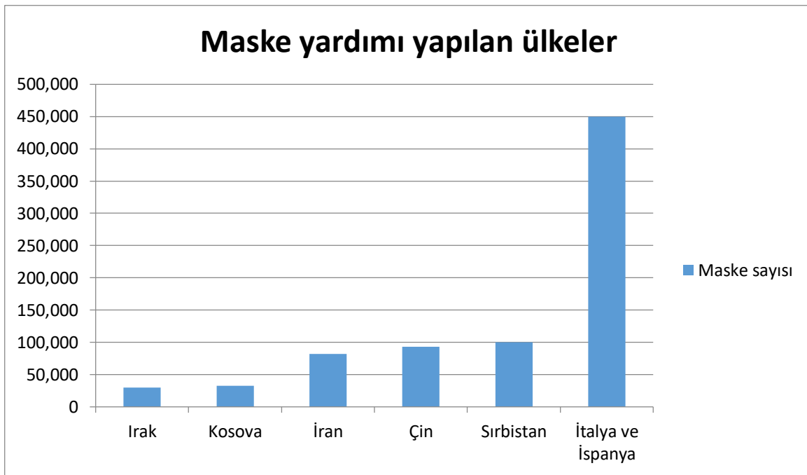
Tablo III: Türkiye tarafından maske yardımı yapılan ülkeler 46

Genel olarak, Gürcistan, Azerbaycan, Kolombiya ve Pakistan gibi ülkelere maske ile birlikte malzeme dağıtımını yapılırken, tulum ve koruyucu malzeme içeren yardım paketleri, gözlük, eldiven ve Covid-19 test kiti dağıtılmıştır. Kolombiya'ya gönderilen 26.250 test kiti gibi tıbbi malzeme gönderiminin yanı sıra, Endonezya'da cami temizliği ve dezenfeksiyonu, Gazze'de hastane başlığı, Romanya'da sağlık merkezi tadilatı, Sudan'da 3D yazıcı başlığı ve