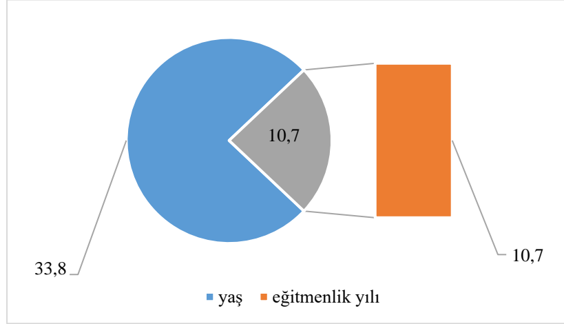
Grafik 1: Araştırma katılımcılarının yaş ortalamaları ve eğitimlik yılı ortalamaları

Araştırma katılımcılarının yaş ortalamaları 33,8 yıl olarak tespit edilirken, eğitimlik yılı ortalamaları ise 10,7 yıl olarak bulunmuştur (Grafik 1). Bu bulgulardan yola çıkarak, araştırma grubunda yer alan ve su sporları merkezlerinde çalışan bireylerin, alanlarında tecrübe sahibi oldukları söylenebilir.