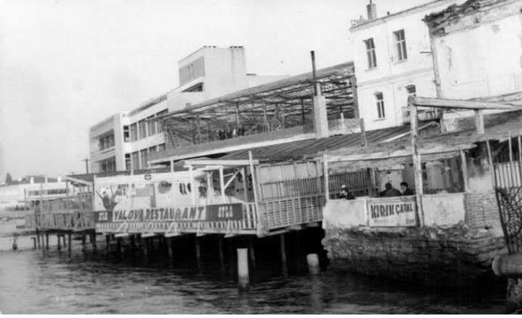
Görsel 3. Yalova Restoran.

bulunan balık hali daha modern bir binaya taşınıncı, bina restorasyon geçirmiştir. Günümüzde ise iki katı ile hizmet vermektedir.