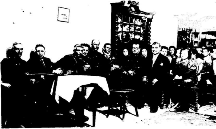
Görsel 2. Belediye Sinema Salonu, 31.12.1936 (Belge-3).

çekleştirilen yoğun katılımlı ilk yılbaşı konser gününe dair aşağıdaki fotoğraf bizlere mekanın birleştiriciliği ve kadın-erkeklerin birlikte eğlenmelerine örnek olabilir.