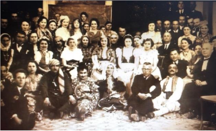
Görsel 1. Halkevi Bahçesinde Cumhuriyet Balosu, tarihsiz (Bir Çanakkale Belgeseli, 2011).

Çanakkale Halkevi'nde düzenlenen balo ve toplantılarda, özellikle Cumhuriyet Bayramı, 30 Ağustos Zafer Bayramı, 23 Nisan Milli Egemenlik ve Çocuk Bayramı, 19 Mayıs Gençlik ve Spor Bayramı ya da Dil Bayramı gibi kutlama/anma etkinliklerinde vatandaşlar ortak mekânı paylaşırlar (Kara- taş, 2014: 73-75). Halkevinde düzenlenen Cumhuriyet'e özgü resmi törenler, müsamereler, tiyatrolar, korolar vatandaşlara milli birlik ve beraberlik duy- gularını aşılarken aynı zamanda kent halkının gündelik işlerini bırakarak evden çıkmalarını sağlayan ve birlikte vakit geçirmelerine vesile olan etkin- likler olarak kendini gösterir. Halkevinde düzenlenen etkinlikler çoğunlukla resmi törenlerdir. Ancak resmi törenler dışında gösteri ve güzel sanat kolla- rının düzenlediği müzikli gösteriler, konserler, piyesler, müsamereler de va- tandaşlar tarafından rağbet görür (Belge-1).