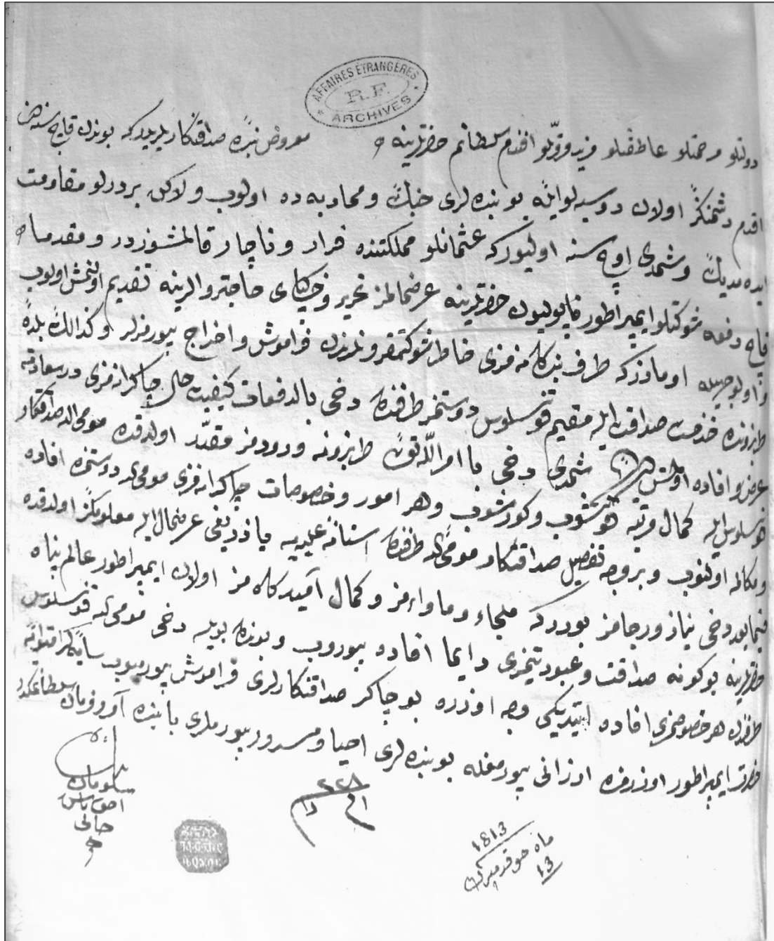
Ek 5: Kral II. Solomon'un Fransa Dışişleri Bakanlığı'na Mektubu (1813)