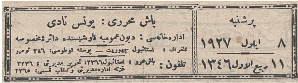
Ftg. 2.1. Gazetenin sağ üst köşesinde bulunan tarih ve iletişim bilgileri

Baş Muharriri: Yunus Nadi İdarehanesi: Duyun-ı Umumiye Karşısında Daire-i Mahsusa Telgraf: İstanbul Cumhuriyet-Posta Kutusu: 246 Numara Telefon: Baş Muharrir: İstanbul 2366 Tahrir Müdüriyeti: 3236 Gazete İdare Müdüriyeti Ve Kitap Kısmı: 2365.