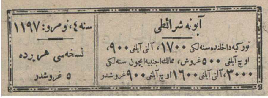
Ftğ. 2.2. Gazetenin sol üst köşesinde bulunan abone şartları, yıl, numara ve fiyat

İncelenen süre içerisinde, gazetenin fiyatı farklılık göstermiştir. 1926 yılının başlarında ülke içindeki fiyatı senelik 1100 kuruş iken sonradan 1700 kuruş olmuştur. Aynı şekilde yine ülke içinde altı aylığı 600 kuruştan 900 kuruşa, üç aylığı 325 kuruştan 500 kuruşa yükseltilmiştir. Yurt dışı aboneliği ise seneliği 2000 kuruştan 3000 kuruşa, altı aylığı 1100 kuruştan 1200 kuruşa ve üç aylığı da 600 kuruştan 900 kuruşa yükseltilmiştir.