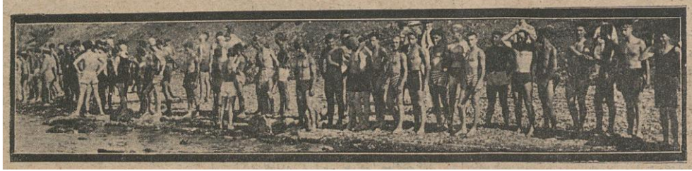
Ftg. 2.2. Gazetenin düzenlediği yüzme yarışmasından bir kare

Gazetenin sporu günlük hayatın bir parçası haline getirmek için doğrudan girişimleri de olmuştur. Cumhuriyet'in Yüzme Müsabakası başlığı altında kadınlar ve erkekler arasında düzenlenen bu yarışmalar ilk olması ve kadınları doğrudan spor dünyasının içine alması bakımından son derece önemlidir.