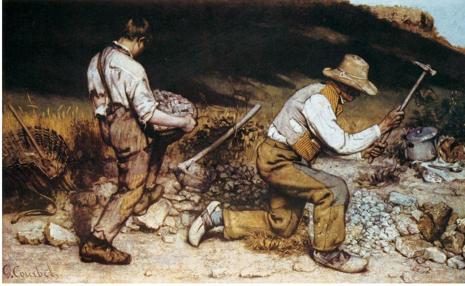
Görsel 2. Gustave Courbet, Taş Kırıcılar (The Stonebreakers), 1849-50, Tuval Üzerine Yağlıboya, 165 x 257 cm. II. Dünya Savaşı Dolaylarında Yok Edildi.