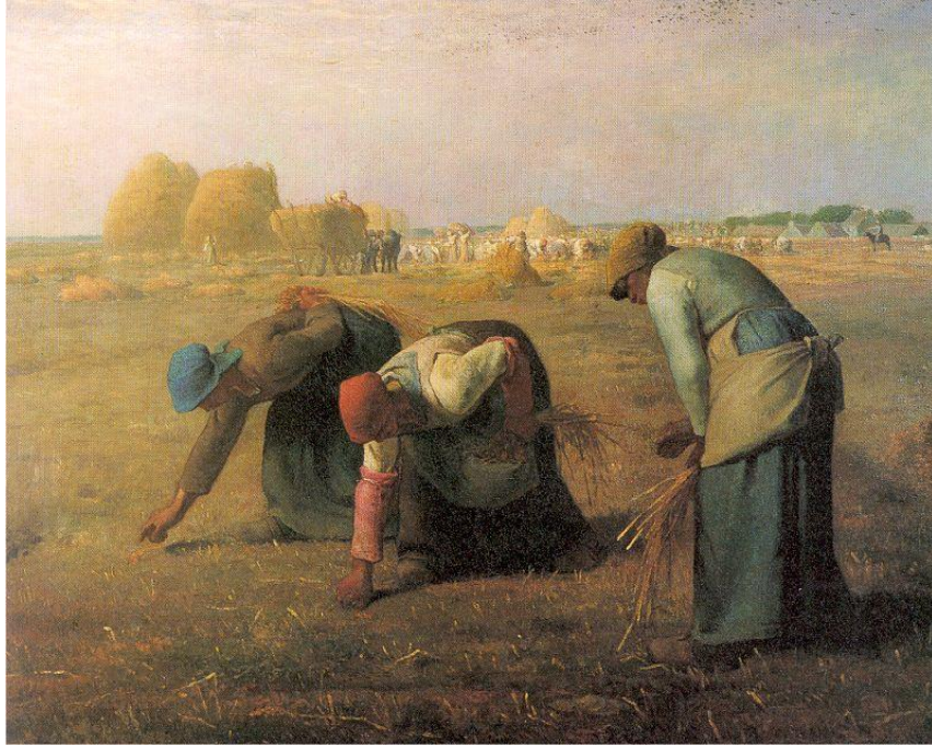
Görsel 4. Jean-François Millet, Hasatçılar (The Gleaners) , 1857, Tuval Üzerine Yağlıboya, 83,5 x 110 cm. II. Musée d'Orsay, Paris.

https://upload.wikimedia.org/wikipedia/commons/6/64/Millet_Gleaners.jpg sayfasından erişilmiştir.