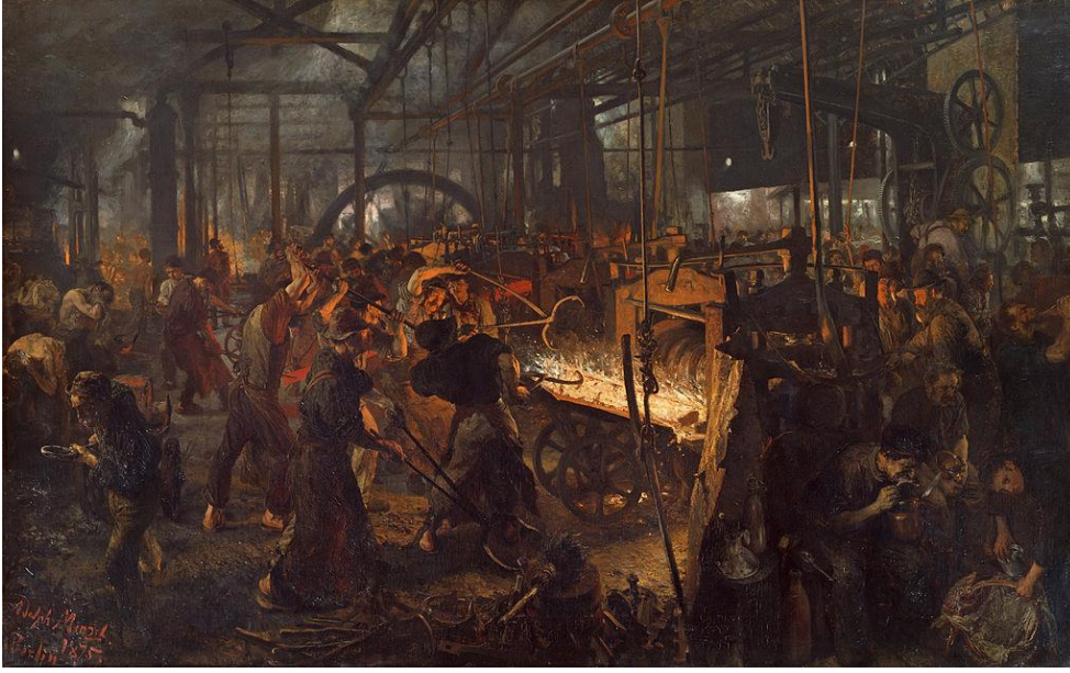
Görsel 6. Adolph Von Menzel, Demir Haddehanesi (Eisenwalzwerk), 1872-75, Tuval Üzerine Yağlıboya, 158 x 254 cm. Staatliche Museen zu Berlin, Berlin. https://upload.wikimedia.org/wikipedia/commons/thumb/4/4a/Adolph_Menzel_-_Eisenwalzwerk_-_Google_Art_Project.jpg/1024px-Adolph_Menzel_-_Eisenwalzwerk_-_Google_Art_Project.jpg sayfasından erişilmiştir.

Yukarıda Görsel 6' de yer alan Demir Haddehanesi adlı eserde gözlemlenen görüntüsel göstergeler arasında işçiler, makine, demir, ateş, dinlenmelik ve mutfak erzakları yer almaktadır. Söz konusu göstergelere ilişkin düz anlam, yan anlam ve derin anlam çözümleri şu şekildedir: