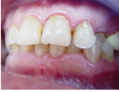
Resim 4. Olgu 2'de restorasyon öncesi sağ lateral dişte mobilite

kırık kron parçası primer stabilizasyon sağlamak için bağlayıcı Clearfil SE bond (Kuraray Co.Ltd,Osaka, Japonya)