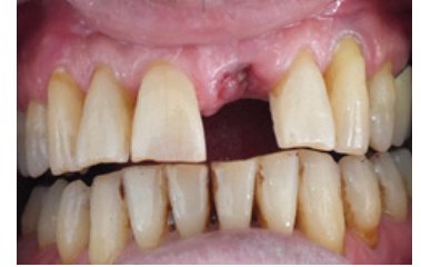
Resim 8. Kök kırığı sebebiyle diş çekimi sonrası görüntü.

Hazırlanan bölgelere self-etching adeziv bağlayıcı sistem Clearfil SE Bond üreticinin talimatına göre uygulandı ve LED ışık cihazıyla (Elipar FreeLight II, 3M Espe, ABD) ile 10 sn polimerize edildi ve daha sonra hibrit kompozit rezin (Clearfil AP-X, Kuraray Co. Ltd, Osaka, Japonya) ile birlikte hazırlanan diş gövde komşu dişlere adapte edildi ve 40 sn LED ışık cihazıyla polimerize edildi. Fiber materyalin açıkta kalan uç kısımlarının uzunlukları özel kesici makas yardımı ile komşu dişlerin lingual yüzeylerine göre ayarlandı. Kompozit bitirme diskleri (Sof-Lex) ile kompozit yüzeyleri düzeltildi ve polisaj işlemi gerçekleştirildi (Resim 9).