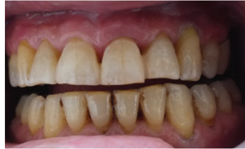
Resim 9. Olgu 3'te tamamlanmış fiberle güçlendirilmiş adeziv köprü restorasyon.

Hazırlanan bölgelere self-etching adeziv bağlayıcı sistem Clearfil SE Bond üreticinin talimatına göre uygulandı ve LED ışık cihazıyla (Elipar FreeLight II, 3M Espe, ABD) ile 10 sn polimerize edildi ve daha sonra hibrit kompozit rezin (Clearfil AP-X, Kuraray Co. Ltd, Osaka, Japonya) ile birlikte hazırlanan diş gövde komşu dişlere adapte edildi ve 40 sn LED ışık cihazıyla polimerize edildi. Fiber materyalin açıkta kalan uç kısımlarının uzunlukları özel kesici makas yardımı ile komşu dişlerin lingual yüzeylerine göre ayarlandı. Kompozit bitirme diskleri (Sof-Lex) ile kompozit yüzeyleri düzeltildi ve polisaj işlemi gerçekleştirildi (Resim 9).