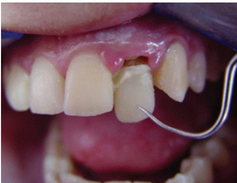
Resim1. Olgu 1'de sağ lateral dişte servikal bölgede kırık

20 yaşındaki bayan hasta travma sonrasında sallanan dişin tedavisi için Selçuk Üniversitesi Dişhekimliği Fakültesi Restoratif Diş Tedavisi A.D.'na başvurdu. Hastada yapılan ağız içi muayenede sağ lateral dişinin mobil ve servikal bölgede kırık hattının olduğu tespit edildi (Resim1).