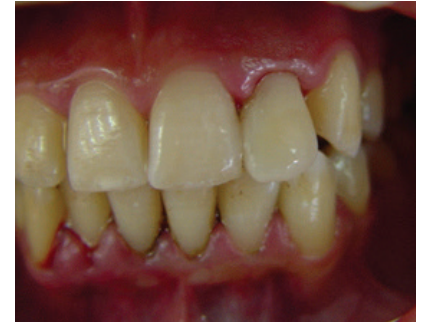
Resim 3. Olgu 1'de tamamlanmış restorasyon sonrası görüntü.

Son olarak palatinaldeki giriş kavitesi Clearfil SE bond ve kompozit rezin ile restore edildi ve kompozit yüzeyleri cilalama diskleri (Sof-Lex, 3M-ESPE, Almanya) ile düzeltip polisaj işlemi gerçekleştirildi (Resim 3).