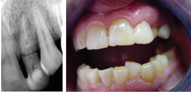
Resim 5. Olgu 2'de kırık kök içerisine polietilen fiber post yerleştirilmesi.

ve kompozit rezin (Clearfil AP-X, Kuraray Co. Ltd, Osaka, Japonya) ile yandaki sağlam dişe splintlendi. Daha sonra apikalde 5mm gutta kalıncaya kadar gutta perka kök kanalından uzaklaştırıldı ve özel frez yardımı ile kök kanalını ve kırık kron parçasını içine alan bir post boşluğu oluşturuldu. Ve rulo haline getirilmiş polietilen fiber Ribbond, Panvia F rezin siman ile post boşluğuna yapıştırıldı (Resim 5).