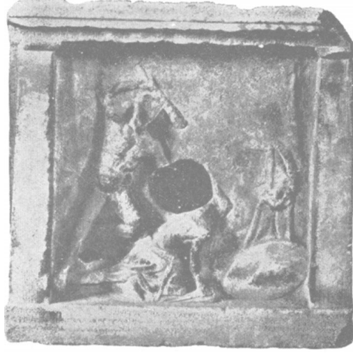
Resim 2 Herakles Galatlı Mücadelesi (İstanbul Arkeoloji Müzeleri) (G. Mendel, İstanbul 1914, Nr. 858 (564))