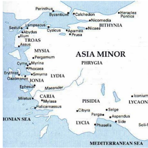
Resim 1 Antik Batı Anadolu Haritası (www.worldcoincatalog.com )