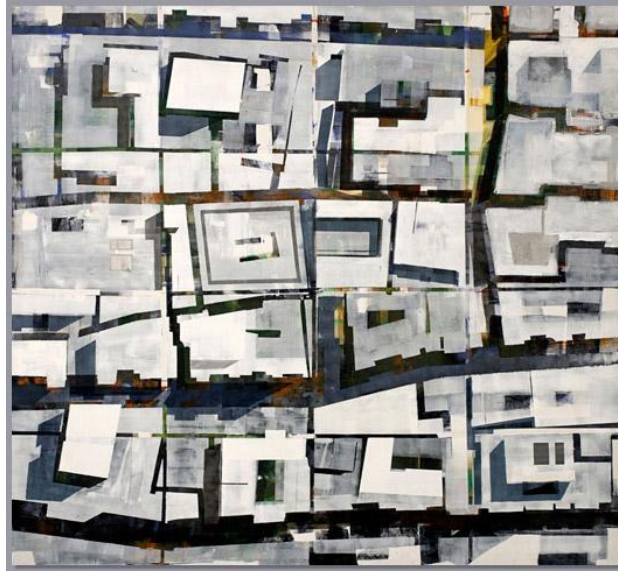
Resim 3: Beyaz Site

Resmin Yorumu: Sanatçının diğer resimlerinde görmediğimiz şekilde perspektif kullanılmıştır. Resimde kullanılan renkler ve resmin adı birbiri ile uyum içerisindedir. Sağ kısımda kullanılan kenarları kırmızı, ortası soluk mor renk ile savaş, ölüm ve güce ithaf yapılmıştır. Resmin ortasında kullanılan binada askerlerin kullandığı yeşil ve kahverengi renk kullanılmıştır. Yeşil doğanın rengi, canlılık ve hareketi temsil etmiş. Kahverengi ise devlet otoritesini ve disiplini temsil etmektedir. Üstte ve binanın altında kullanılan mavi ise Türklere kutsal sayılan mavidir ve aynı zamanda mavinin sakinleştirici etkisini de yeşilin canlılığına karşı zıtlık oluşturmak için kullanmıştır. Bu mavi kullanımı da güveni sembolize etmiştir. Resim genel anlamda sert ve soğuk bir resimdir. Resimde devletin gücüne perspektifle bir bakış atılmak istenmiştir (Resim-2).