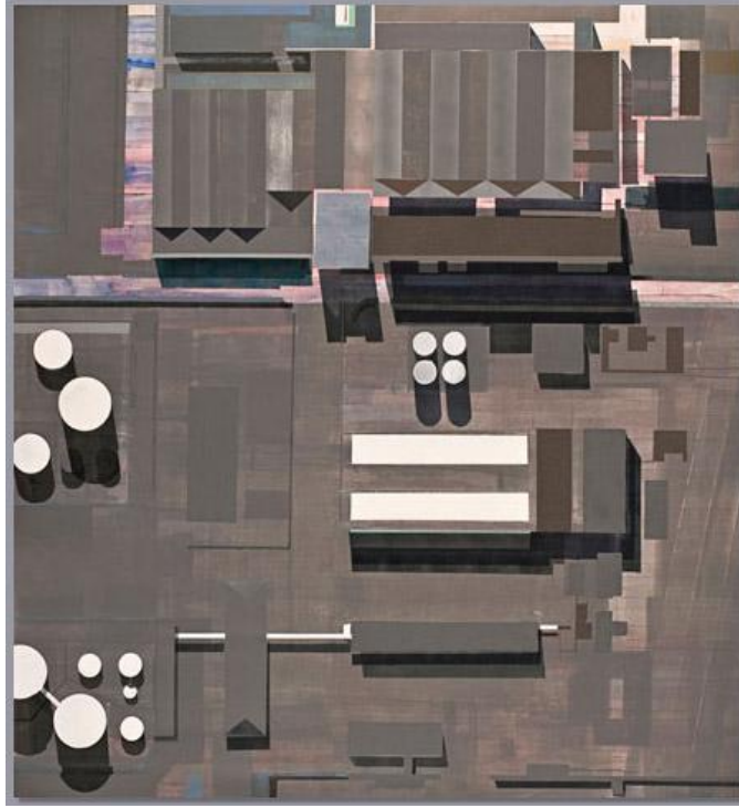
Resim 6: Rafineri

Resmin Analizi: Köşeli formların yanı sıra yuvarlaklara yer verilmiştir. Sanatçının diğer resimlerinde olduğu gibi dikdörtgenler ve üçgenler kullanılmıştır. Orta kısımdaki yatay iki beyaz dikdörtgene karşılık ortada ve solda kullanılan beyaz yuvarlaklarla dengelenmiştir. Arka planda orta ton bir kahverengi kullanılmıştır. Yer yer mora çalan pembelere ve mavilere de resimde yer verilmiştir (Resim-6).