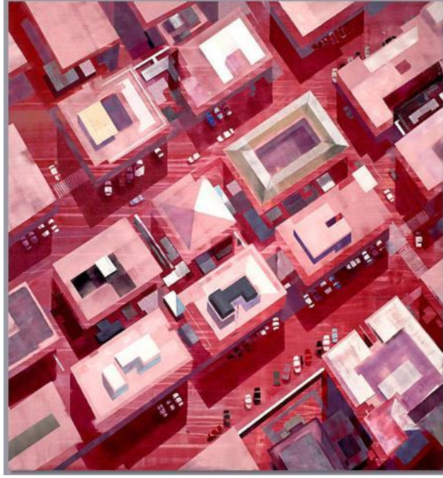
Resim 4: Büyük Plan

Aralarda kullanılan siyah renk ile de bu insanların kederlerine ve üzüntülerine değinilmiştir. Resim genel olarak rahatlatıcı ve canlı bir resimdir (Resim-3).