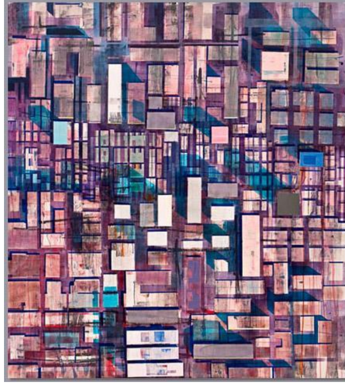
Resim 8: Yeni Kıta Eski Şehir

Resmin Analizi: Sanatçının bu eserinde çok daha fazla ve küçük dikdörtgene yer verilmiştir. Binaların gölgesi olarak düşünülen alanlar mavi ile boyanmıştır. Maviye karşılık mora çalan bir kırmızı renk ile bütünlük yakalanmaya çalışılmıştır. Genel olarak soğuk bir resimdir. Kahverengiler, maviler ve morlardan oluşmuştur (Resim-8).