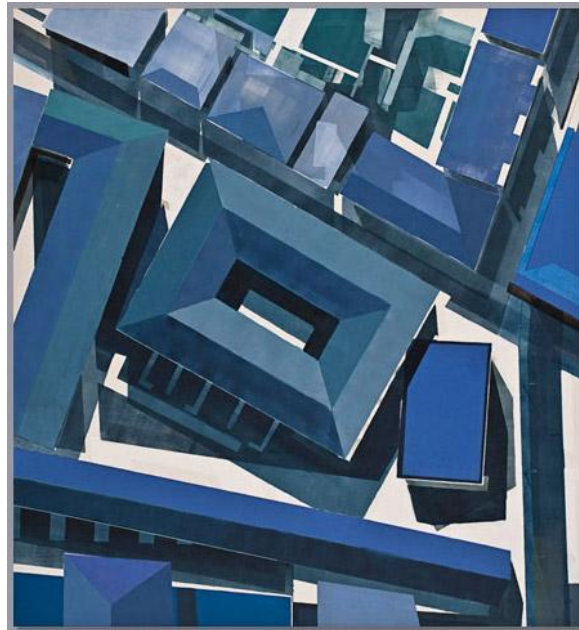
Resim 1: 66'dan Manzara