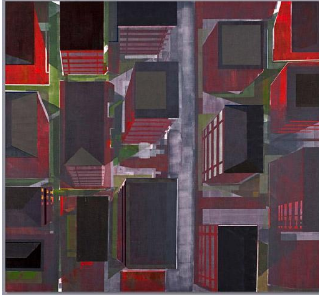
Resim 5: Gece

Resmin Analizi: Resim kırmızı ve yeşilin gri tonlarını çok fazla barındırmaktadır. Köşeli formlar yine çalışmada kullanılmıştır. Resimde dikeyler çok fazla olup, orta kısımdaki açık gri dikey ile sol ve sağdaki perspektif alanları birbirinden ayırmıştır. Ayrıca resimde küçük yataylar ile dikeyler desteklenmiştir. Kırmızı ve yeşil kullanılarak zıtlıklar yakalanmıştır. Bunun yanı sıra gri tonlar kullanılarak kırmızı ve yeşile karşılık orta tonlar da yakalanmıştır (Resim-5).