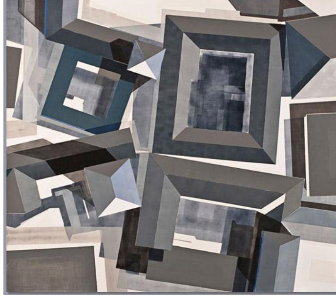
Resim 7: Tarihi Plan

Resmin Analizi: Resim kahverengi ve beyazın tonları şeklinde boyanmış ve yine köşeli formlara yer verilmiştir. Gölgele hafif maviye çalan fümeyle boyanmıştır. Köşeli ve sivri uçlu formlar dikkati çekmektedir. Diyagonal hatlardan yararlanılmıştır. Genel olarak soğuk bir resimdir (Resim-7).