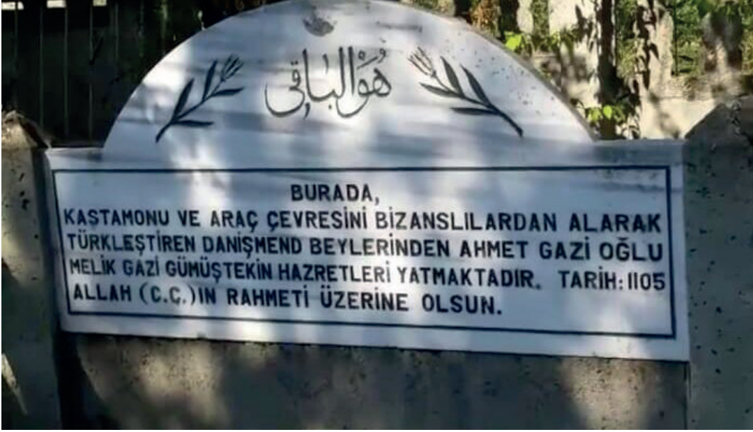
Resim 1. Ahmet Gazi oğlu Melik Gümüştekin Gazi türbesi.