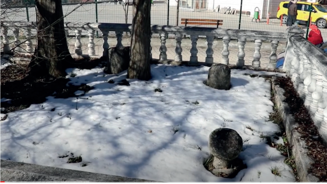
Resim 3. Araç Abdal Paşa Türbesi'nden geride kalan mezar.

Eldeki bilgilere göre Abdal Paşa ailesiyle XIV. yüzyılın başlarında muhtemelen Konya'dan göç ederek Yukarı Araç'a gelip yerleşmiştir (Yaşar, 1990: 70-72). Araç'ın en eski sakinlerinden olan bu aile soy olarak günümüzde devam etmektedir. Abdal Paşa Zaviyesi türbe, misafirhane ve aşhane gibi binalardan müteşekkildi. Üstü açık türbe içerisinde Abdal Paşa'nın dışında İsfendiyar Bey'in eşi Tatlı Hatun'a ait mezarın da bulunduğu iddia edilmekteyse de bu bilgi doğru değildir. Keza Tatlı Hatun'un mezarı Sinop şehir merkezinde İsfendiyarlar Türbesi'ndedir. Vakfiyede zikredilmeyen, ancak daha sonra yaptırılan zaviye imarethanesi günümüze ulaşmamıştır. Araç'ta eski rüştiye binaları yıkıldığında imaretin kurnalarının ortaya çıktığı zikredilmiştir (Yaşar, 1990: 70-72). Araç Çayı üzerinde tesis edilen bu zaviyenin ilçede İslâmi döneme ait en eski yapı olduğu ve yerleşimin ilk nüvesini teşkil ettiği dile getirilmiştir (Yakupoğlu, 2009c: 21-23).