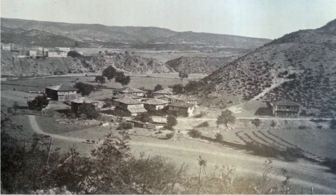
Resim 2. Alman seyyah ve fotoğrafçı Richard Leonhard'ın objektifinden XX. yüzyılın başında Araç (Çolak, 2018: 232).

Araç, iki asra yakın Candaroğulları idaresinde kaldıktan sonra ilk olarak 1392-1402 yılları arasında (Öztuna, 1964: 75, 113), daha sonra 1421'de Araç'a tabi Boyalı nahiyesinden başlayarak (Uzunçarşılı, 1988: 132), nihayet Fatih Sultan Mehmet döneminde (1451-1481) 1460-1461 yıllarında Kastamonu ile birlikte Osmanlı idaresine ilhak edilmiştir (Âşıkpaşaoğlu Tarihi, 1970: 176-177, 181; Münecimbaşı Ahmed Dede, 323-324, 326). Osmanlı döneminde de Araç'taki dinî hayatın yansımalarından olan zaviye ve türbeler önemini korumaya devam etmiştir. Dinin yaşanması ve halka anlatılması konusunda önemli roller üstlenen, sosyal ve kültürel yaşamda etkili olan tekke, zaviye ve türbelere Osmanlı döneminde yenileri