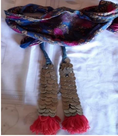
Fotoğraf 3: Küçük Paralı Tülbent