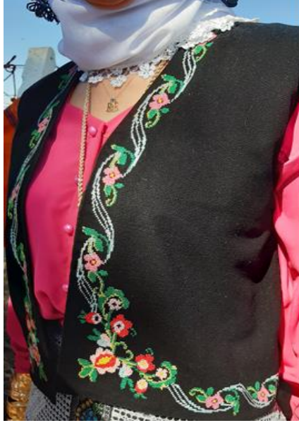
Fotoğraf 20: Kanaviçe İşleme yelek