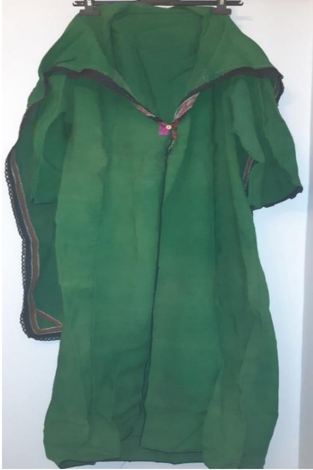
Fotoğraf 23: Yeşil Ferace