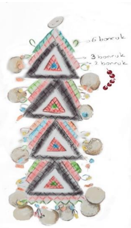
Çizim 2: Boncuklu ağca çizim örneği.