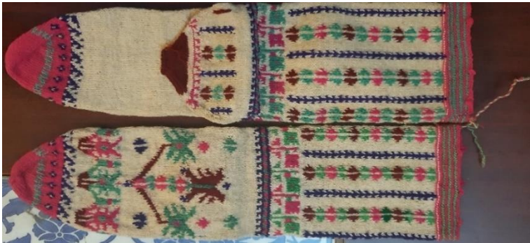
Fotoğraf 24: Eriş Çorap (, 13.06.2021)