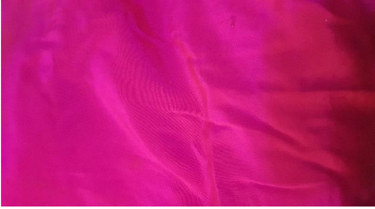
Fotoğraf 19: Pembe gömlek kumaşı yakından çekim ( 13.06.2021)