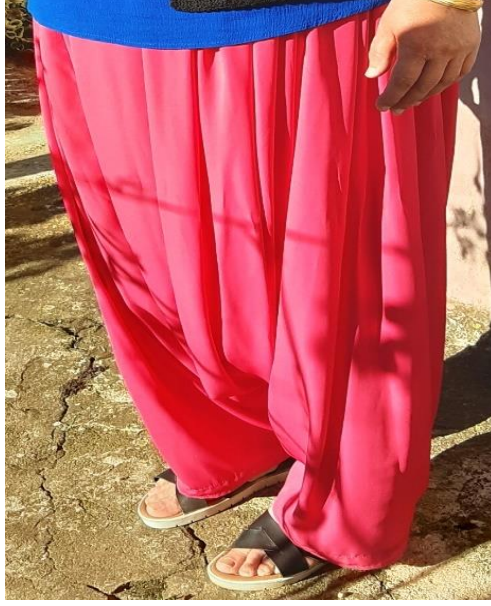
Fotoğraf 21: Şalvar