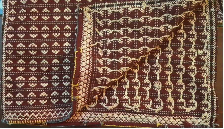
Fotoğraf 22: Fita (Futa) ön ve arka detay

Fotoğraf 22’görülen Futa dokumada “Dimi dokuma örgüsü” ile “Cicim” tekniği bir arada kullanılmıştır.