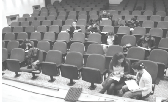
Resim 1. Çalıştay Katılımcıları ve Sunum Materyalleri

Bu çalışma, Engelsiz ODTÜ Top- luluğunun 20. yıl kutlamala- rı kapsamında daveti üzerine “neden görme engellilere fizik öğretimi konusunda çalışmaya başlandığının ve denenen bazı materyallerin geliştirilme süreç- lerinde nelere dikkat edildiğinin” açıklandığı sunum ile sunum sonrasında gönüllü öğrencilerin (Resim 1) enerji ünitesi için “ne- ler yapılabileceği” konusundaki önerilerini içermektedir.