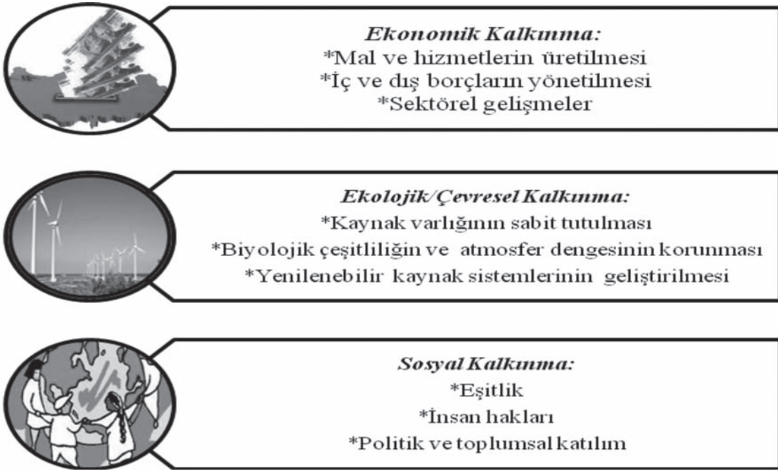
Şekil 1. Sürdürülebilir Kalkınmanın Ekonomik, Ekolojik/Çevresel ve Sosyal Boyutları