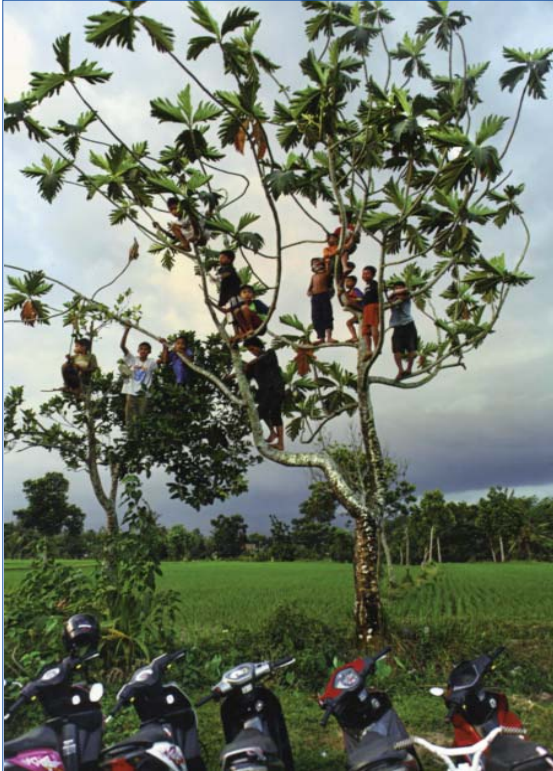
Fotoğrafi "Ağacın Meyveleri" Dr. Can Eren TTB-STED Fotoğraf Yarışması 2012 Sergi Ödülü

Sürekli Tıp Eğitimi Dergisi'nin (STED) yeni sayısını sunarken, dergi yayın politikasına ilişkin kimi konuları anımsatmakta yarar olacağını düşündük. STED'i hazırlarken, birinci basamak sağlık hizmetinin değişik noktalarında çalışan hekim, hemşire ve diğer sağlık personeline günlük çalışmalarında yararlı olabilecek, aynı zamanda birinci basamak sağlık hizmeti alanında akademik çalışmaları ve araştırmaları özendirecek bir yayın ortaya koymaya çalışıyoruz. Ekip hizmeti tıbbın her alanında ama özellikle de birinci basamak sağlık hizmetinde yaşamsal önemdedir. Bu nedenle STED'i yalnızca hekimlerin değil, başta hemşirelik alanında çalışanlar olmak üzere diğer sağlık meslek üyesi meslektaşlarımızın da benimsediğini görmek sevindiricidir.