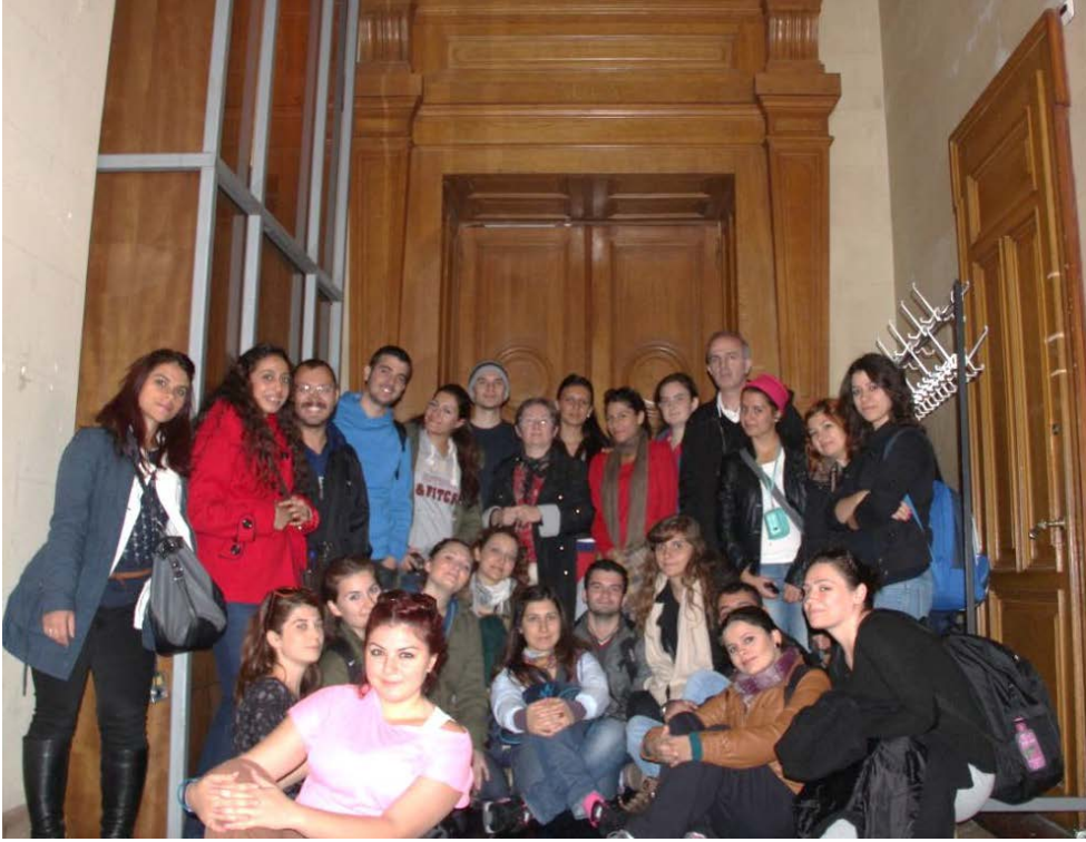
Foto 17: Lozan Antlaşması'nın imzalandığı Aula Salonu önünde, Palais de Rumine/Lozan/İsviçre.