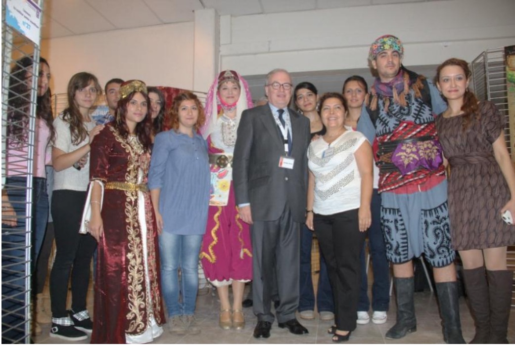
Foto 9: Saint-Dié-des-Vosges Belediye Başkanı Christian Pierret, Yrd.Doç.Dr. Arife Karadağ ve öğrencilerimiz.