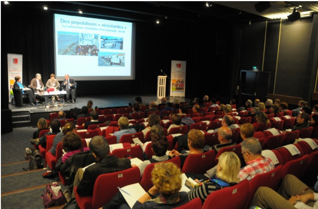
Foto 1: Uluslararası Coğrafya Festivali Açılış Töreni (Saint-Dié-des-Vosges/Fransa).

23.cü Uluslararası Coğrafya Festivali, 11-14 Ekim 2012 tarihleri arasında gerçekleşmiştir. Festivalin bilimsel ortamda o sene için belirlenen coğrafya konularını işlemek, davetli ülkeyi tanımak-tanıtımak, coğrafya bilimini yaygınlaştırmak ve halkla buluşturmak işlevi başarıyla amacına ulaşmıştır. Festivaldeki tüm etkinliklerde birkaç konferans, poster ve belgesel gösterimi hariç hakim dil Fransızca’dır. Bununla birlikte, İngilizce gibi diğer dillerden başvuran olduğu takdirde kolaylık gösterilmektedir.