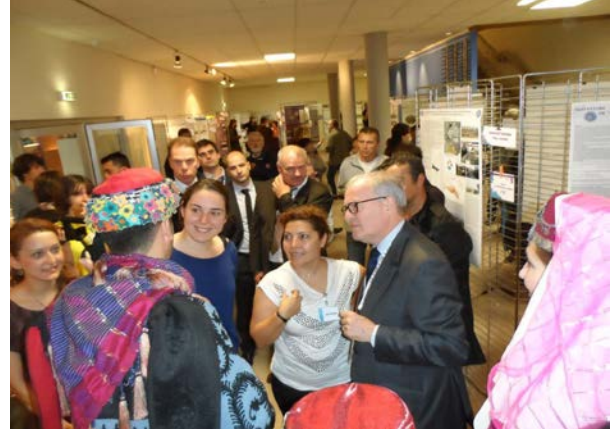
Foto 4-5-6-7: FIG 2012 Bilimsel Poster Sergisi'ndeki posterlerimiz, öğrencilerimiz ve ziyaretçiler.