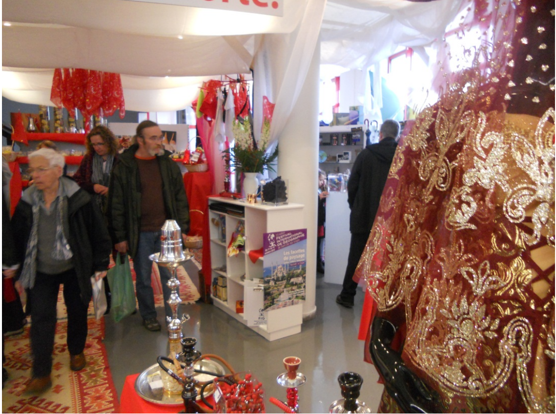
Foto 3: Uluslararası Coğrafya Festivali'nde Türkiye Sergi Evi (Saint-Dié-des-Vosges/Fransa).