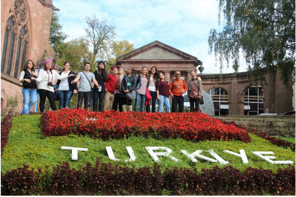
Foto 2: Uluslararası Coğrafya Festivali'nde davetli ülke: Türkiye (Saint-Dié-des-Vosges/Fransa).