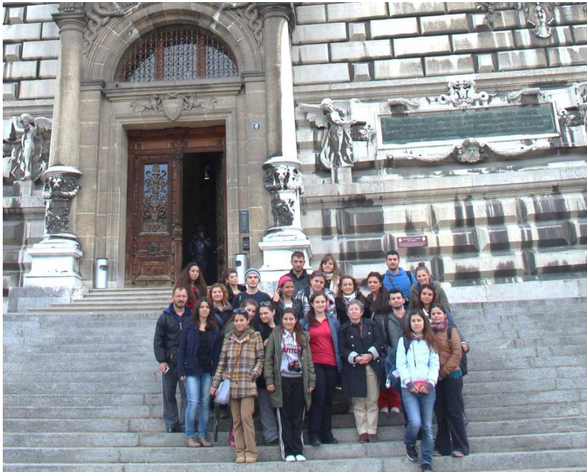
Foto 16: Lozan Antlaşması'nın imzalandığı Palais de Rumine (Rumine Sarayı), Lozan/İsviçre.