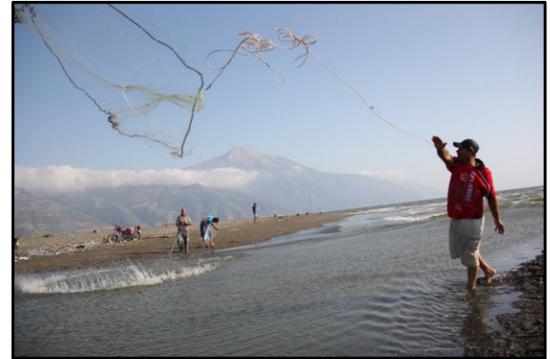
Fotoğraf 2. Asi'nin ağzında balıkçılar. Serpme ile balık tutuyorlar.