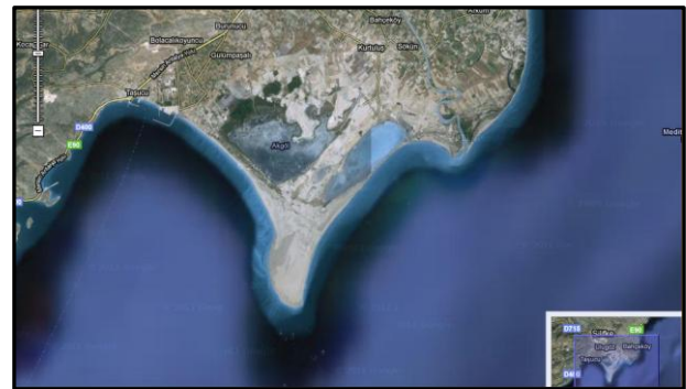
Şekil 1. Göksu deltası

Akgöl lagününü gözlemliyoruz. Lagünün ağzında kurulmuş dalyana girebilmek için zor izin alıyoruz. Malum balık avlanacak. Ancak balıkçılar İstanbul Üniversitesi Coğrafya Bölümü öğretim üyelerinden Orhan Gürbüz hocanın köylüleri çıkıyor, karşılıklı selamlaşmalardan sonra giriyoruz. Kıyı oku üzerinde ilerliyoruz. Lagünün ağzında bir karaltı var kıyıda. Devasa bir Caretta caretta . Neredeyse 1 m çapında. Korkuyor ve suya dalıyor. Lagünün ağzında birkaç tanesi dolaşıyor. Sanırım balık kovalıyorlar. Kaçanlar dalyana kaçamayan Carettaya.