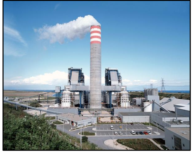
Sugözü Termik Santrali

Çok geç kaldık. Tarsus etabını ertesi güne bırakarak Mersin'e geçiyoruz. Gece yine Mersin'de Macit Özcan Spor Kompleksi'nde konaklıyoruz.