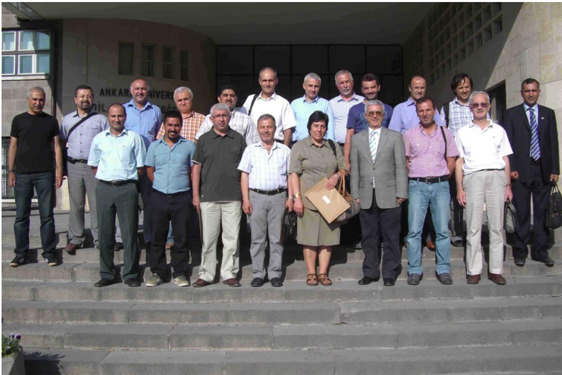
Coğrafya Mesleği Tanırılığ Çalıřtayı – Ankara (4.7.2011)

- 04 Temmuz 2011 tarihinde Türk Coğrafya Kurumu'nun koordinatörlüğü ve Ankara Üniversitesi Dil ve Tarih-Coğrafya Fakültesi Coğrafya Bölümü Başkanlığının evsahipliğinde (Prof.Dr. İhsan Çiçek hocanın organizasyonu) «Coğrafya Mesleği Tanırılığ Çalıřtayı», Ankara'da düzenlenmiştir. Ülkemizdeki Davet edilen 34 kurumdan (24'ü coğrafya bölümü; 10'u coğrafya öğretmenliği anabilim dalından) 14'ü temsil edilmiştir.