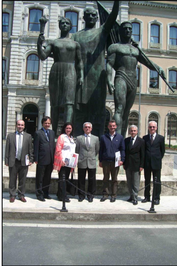
TÜRK COĞRAFYA KURUMU YÖNETİM KURULU (2010-2013)

10 Ocak 2010 Pazar günü Türk Coğrafya Kurumu (TCK) Olağan Genel Kurulu'nda seçilen idari kurulları 2011 yılında da faaliyetlerini sürdürmüşlerdir: