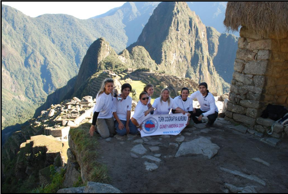
Güney Amerika Overland'ına katılan ekip Machu Picchu'da