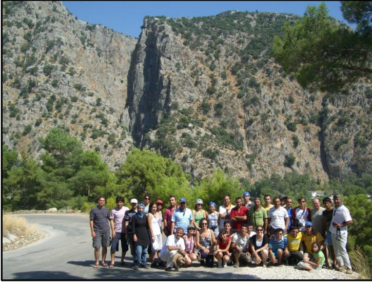
Saklıkent kanyonu, Muğla