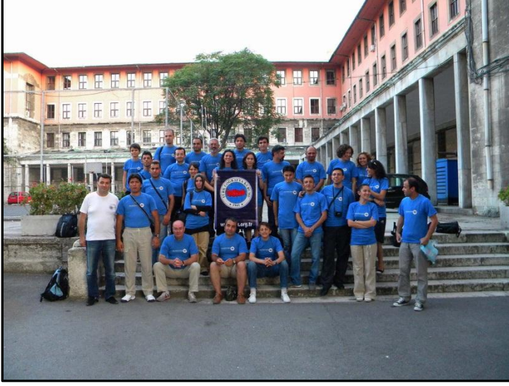
İstanbul Üniversitesi'nden yola çıkarken.