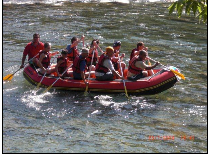
Köprüçay'da rafting, Antalya.