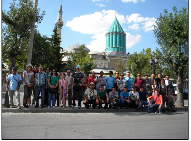
Mevlana Müzesi'nin önü, Konya.