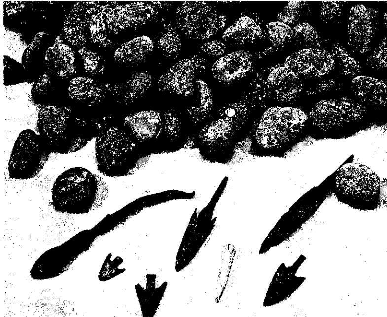
Foto 4: Savaşın En Önemli Kanıtları: Sapan Taşları ve Mızrak Uçları.

dar sokaklarından geçmek ve kentin sağlam surlarına ulaşmak zorundadır. Bu durum yukarı kentte neden çok fazla mızrak ucu bulunmadığını da izah etmektedir. Çünkü kale, çağın uzun menzilli silahı olan mızrakların menzili (100m) dışındadır. Fakat aşağı kentte tunç mızrak uçları ve kilden sapan taşları bulunmuştur. Ayrıca güney kapısı yanında bir ev içinde sapan taşı yığını bulunmuştur. İçeride kil sapan taşlarının sıcakta sertleşmesi için yakılan bir ocak bulunmaktadır. Burası "silah deposu" olarak adlandırılmıştır. Müzelere konan tunç çağının silahları olan mızrak uçları ve sapan taşları da Troya savaşının silahları olarak savaş turizmi için önemlidir (Foto 4). Troya kentinde destanda anlatılan Priamos'un sarayının alt taş duvarları da Akropolis'te yer almaktadır.