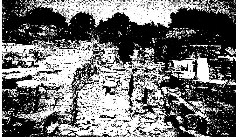
Foto 3: Kentin Güney Kapısı, Taş Döşeli Yol ve Kule'nin Kalıntıları

dar sokaklarından geçmek ve kentin sağlam surlarına ulaşmak zorundadır. Bu durum yukarı kentte neden çok fazla mızrak ucu bulunmadığını da izah etmektedir. Çünkü kale, çağın uzun menzilli silahı olan mızrakların menzili (100m) dışındadır. Fakat aşağı kentte tunç mızrak uçları ve kilden sapan taşları bulunmuştur. Ayrıca güney kapısı yanında bir ev içinde sapan taşı yığını bulunmuştur. İçeride kil sapan taşlarının sıcakta sertleşmesi için yakılan bir ocak bulunmaktadır. Burası "silah deposu" olarak adlandırılmıştır. Müzelere konan tunç çağının silahları olan mızrak uçları ve sapan taşları da Troya savaşının silahları olarak savaş turizmi için önemlidir (Foto 4). Troya kentinde destanda anlatılan Priamos'un sarayının alt taş duvarları da Akropolis'te yer almaktadır.