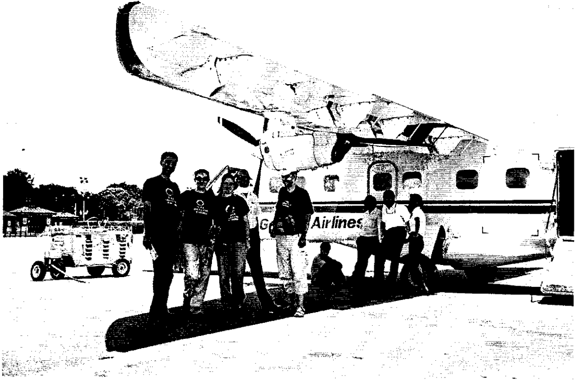
Foto 4: Nepal Katmandu Havaalanından Lukla'ya Uçmak İçin Türk Coğrafya Kurumu Üyeleri Fügen Dede, Nurcan Demiralp, Cem Yıldız, Mesut Süzer Uçağın Havalanmasını Beklerken