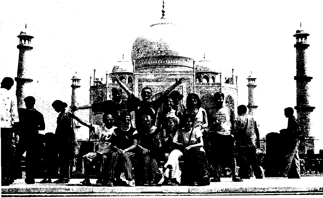
Foto 2: Geziye Katılan Coğrafya Öğretmenleri Hindistan Agra'da Taç Mahal Önünde