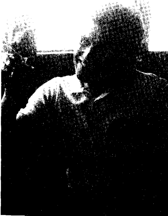
Foto 12. Meslektaşları, dostları, öğrencileri ve yakınlarının kalbinde daima hatırlanacak görüntüsüyle....