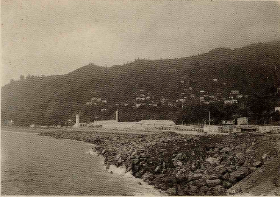
Foto 1. Türkiye-Gürcistan Sınırında Yeralan Sarp Sınır Kapısı Photo 1. Sarp Border Gate Located at the Frontier of Turkey-Georgia