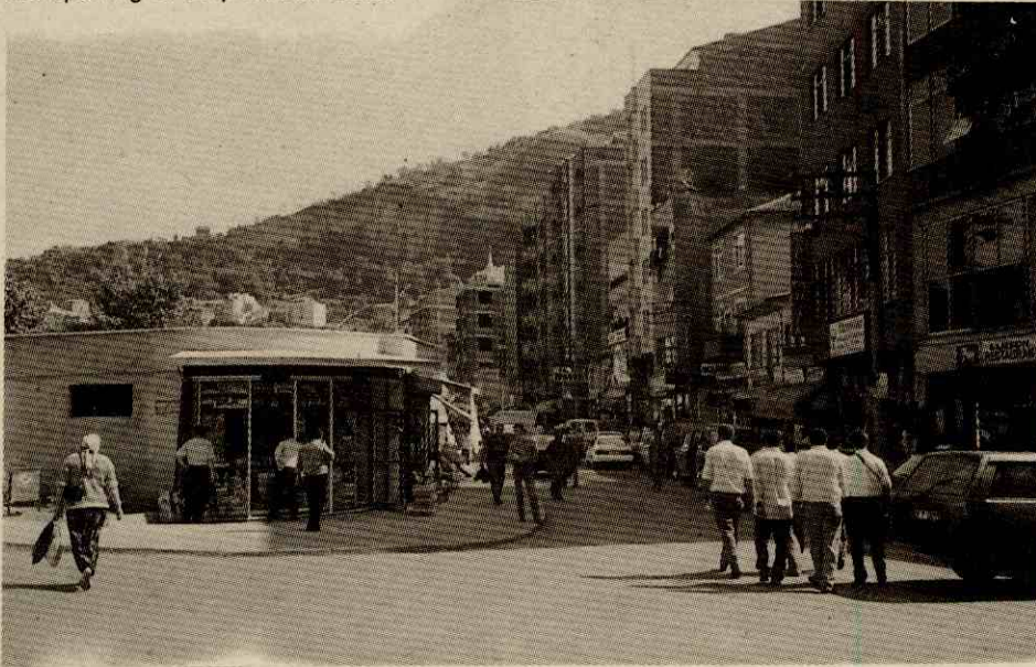
Foto 4. Trabzon'da ticaret fonksiyonunda yaşanan değişimlere bağlı olarak gelişen İskele Caddesinden bir görünüm.

Photo 3. A view from Çömlekçi Street that has witnessed important improvements in respect of surrounding due to the changes in the function of commerce in Trabzon after the opening of Sarp Border Gate.