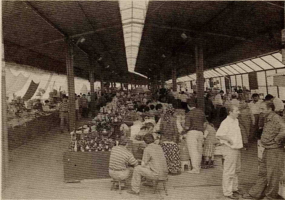
Foto 2. Sarp Sınır Kapısının açılışından sonra Trabzon'da kurulan "Rus Pazarı"ndan bir görünüm Photo 2. A view from the "Russian Bazaar" set in Trabzon after the opening of Sarp Border Gate