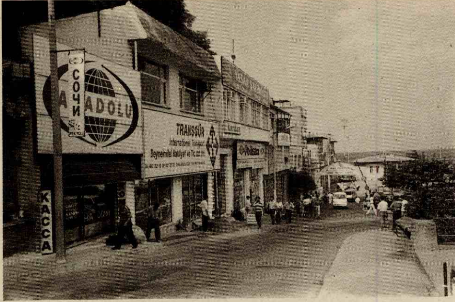
Foto 3. Sarp Sınır Kapısının açılışından sonra Trabzon'un ticaret fonksiyonunda yaşanan değişimlere bağlı olarak mekansal açıdan önemli gelişmelere sahne olan Çömlekçi Mahallesi'nden bir görünüm.

Photo 3. A view from Çömlekçi Street that has witnessed important improvements in respect of surrounding due to the changes in the function of commerce in Trabzon after the opening of Sarp Border Gate.