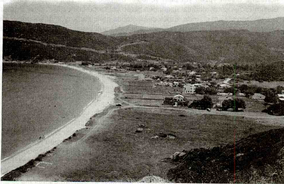
Foto 5: Büyük Faflima koyundaki tarım arazileri üzerinde yer alan ikinci konutlar

Photo 5: Secondary residences taking place on agricultural land at Büyük Faflima Bay