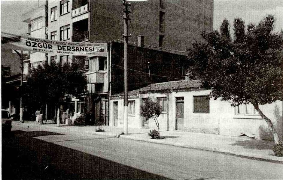
Foto 2: Erdek Şehir merkezinde clearing faaliyetine örnek Photo 2: An example to clearing activities at Erdek's city center

Günümüzde dört mahallesi (Alaaddin, Atatürk, Halitpaşa, Yalı) olan Erdek şehri, 1960'lı yıllarda başlayan turizm hareketleri ile bağlantılı olarak yerleşim alanını genişletmeye başlamıştır. Kentin turizm olgusu doğrultusunda alansal bakımdan genişlemesi, özellikle 1980'li yıllardan itibaren yapımı hızlanan ikinci konutlar ile en yüksek düzeye ulaşmıştır. Nitekim Seyitgazi tepesine kadar uzanan güney kıyı kesimi 5-6 kat yükseklikteki ikinci konutlarla, Çura burnuna kadar olan kuzey kıyı kesimi ise 4-5 katlı apartman biçimindeki yazlıklar, otel, motel gibi turistik tesisler ve kamu kuruluşlarına ait dinlenme tesisleri ile tamamen dolmuş durumdadır. Bu biçimde kent 1980'li yıllarda kuzey-güney kıyıları boyunca yerleşim alanını genişletirken, 1985 yılından itibaren kıyıdan uzakta yer alan Atatürk ve Alaaddin mahallelerinde büyük bloklu apartmanların yapılması ile batıya doğru gelişmeye başlamıştır. Bunlardan Alaaddin mahallesinde gecekondu önleme bölgesi olarak ilan edilen sahada yapılmakta olan 400 konutluk kooperatif blokları kentin yakın gelecekteki yerleşim alanının gelişme yönünü göstermesi bakımından dikkat çekicidir. Diğer taraftan eski tek veya 2 katlı evle-