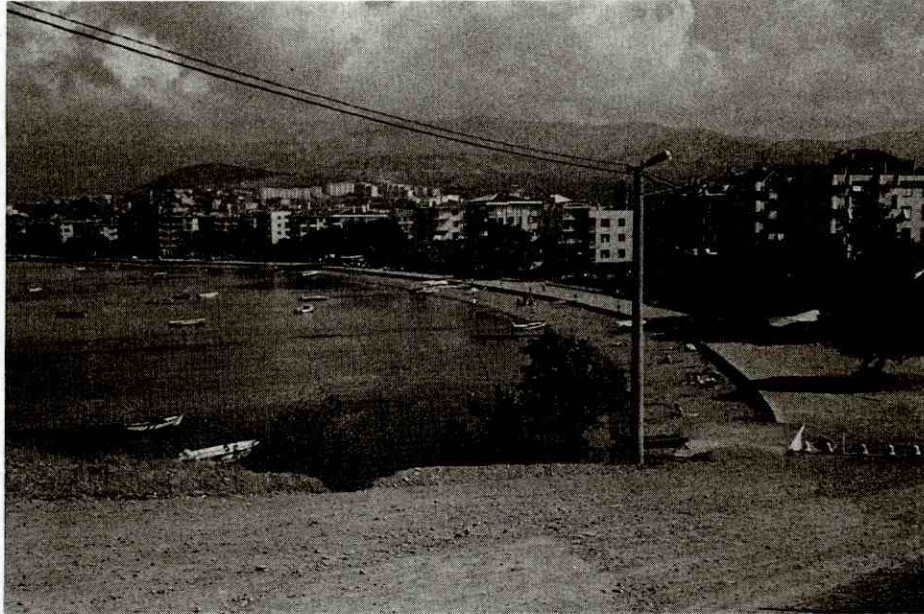
Foto 4: Seyitgazi Tepesinden Erdek şehri kıyılarına bakış Photo 4: A view of Erdek city shores from the Seyitgazi hill.