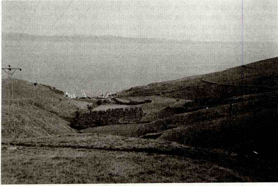
Foto 3: Çakıl - Karşıyaka Köyleri arasındaki gemi çekek yeri, ön planda tahıl tarlaları Photo 3: A boat careening place taking place between the Çakıl and Karşıyaka villages with grain fields in foreground.

Kapıdağ yarımadasında ortadan kalkmakta olan diğer bir ekonomik faaliyet de taş ocaklarıdır. Yarımadanın doğu ve batısında bulunan granit masifinin varlığı ile eski çağlardan beri işletilmekte olan taş ocaklarının en faalleri doğu granit masifinde Hamamlı ve Tatlısu köylerinde, batı granit masifinde ise Ocaklar ve Narlı köylerinde yer almıştır. Şahısların kiralaması ile işletmeye açılan ocaklarda parke taşı ve kaldırım taşı yapılmaktaydı. Söz konusu taş ocaklarının en büyükleri ise Bandırma limanı yapılırken buraya malzeme gönderen Tatlısu köyündeki ile 1938 yılında İtalyanlar tarafından açılan Ocaklar köyündeki idi. Ancak parke taşının asfalta oranla maliyetinin daha yüksek olması nedeniyle alıcı bulamaması yanında, turizmden elde edilen gelirlerdeki artış, geçmiş yıllarda hemen hemen köy halkının bütün erkeklerinin çalıştığı taş ocaklarını bu kez işçi bulamama sorunuyla karşı karşıya getirmiştir. Nitekim 1975 yılında Ocaklar, 1980 yılında Narlı ve son olarak da 1994 yılında Tatlısu köyündeki taş ocakları kapanmıştır. Ocaklar köyünde yer alan taş ocağı 1992 yılında Karadeniz’li bir işadamı tarafından satın alınarak işletilmek istenmişse de işçi sorunu nedeniyle tam kapasiteli olarak üretime geçememiştir.