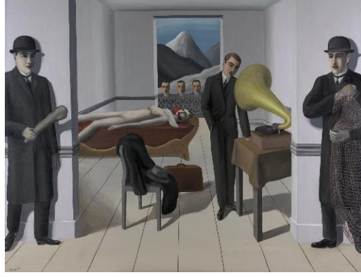
Görsel 8. Rene Magritte, 1927, Tehdit Altındaki Katil, Tuval üzerine yağlıboya, 150 x 195 cm.

Gizemli ve dingin resimleriyle bilinen Magritte Gerçeküstüçülük akımının üyelerinden biridir. Onun, Tehdit Altındaki Katil adlı resminin esin kaynağı, Lucie-Smith'e (2004, s.137) göre "1920'lerde yayınlanan adi suçlarla ilgili dergilerdir". Resimde bir cinayet mahalli görülmektedir ve olabildiğince yalın, gereksiz unsurlardan arındırılmış bu sahnede