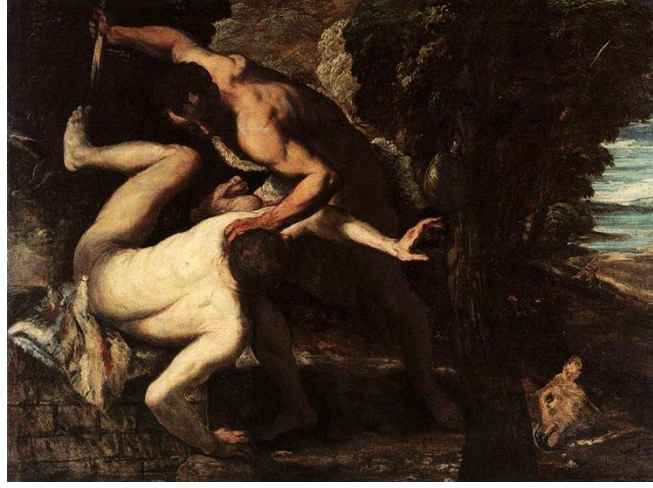
Görsel 3. Tintoretto, Hâbil ve Kâbil, 1551-1552, Tuval üzerine yağlıboya, 149 x 196 cm.

Tevrat'a göre (Tekvîn, 4/1-2) Kâbil Hz. Âdem ile Havvâ'nın ilk, Hâbil ise ikinci oğludur. Hâbil koyun çobanı, Kâbil ise çiftçi olmuş, bir müddet sonra Kâbil toprağın mahsulünden, Hâbil de sürünün ilk doğanlarından ve yağlarından rabbe takdime sunmuş, fakat rab Hâbil'in takdimesini kabul etmiş, Kâbil'inkine bakmamıştır. Buna çok öfkelenen Kâbil, rabbin ikazına rağmen kardeşi Hâbil'i öldürmüştür. https://islamansiklopedisi.org.tr/habil-ve-kabil