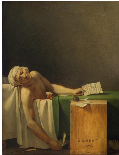
Görsel 4. Jacques Louis David, Marat'ın Öldürülmesi, 1793, Tuval üzerine yağlıboya, 162 x 128 cm.