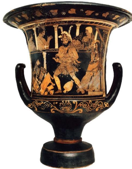
Görsel 2. Asteas, Herakles'in Cinneti, MÖ. 350-320, Ölçü: 55 cm.