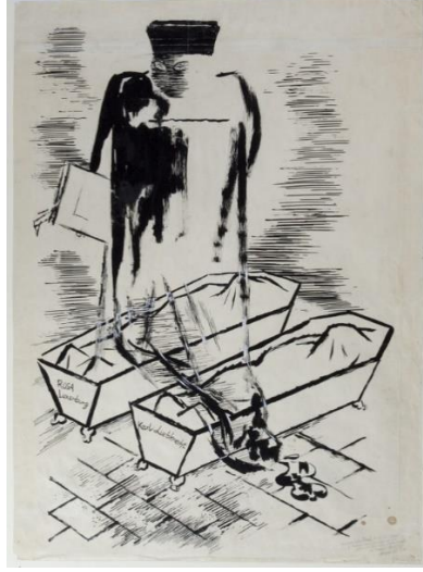
Görsel 7. George Grosz, Rosa Luxemburg ve Karl Liebknecht'in Anısına, 1919, Kâğıt üzerine mürekkep, 61.5 x 44 cm.

James Ensor'un sanatında ele aldığı konulara bakıldığında Görsel 6'daki resim hiç de şaşırtıcı değildir. Genelde kimi zaman kuru kafalar yoluyla ölüm konusunu işleyen sanatçı, Cinayet adlı resmini Edgar Allan Poe'nun 1845'te yazdığı Bay Valdemar Vakasındaki Gerçekler adlı kısa öyküden yola çıkarak yapmıştır. Poe'nun bu öyküsünde, bir deney gereği ölmek üzere olan ve çok az ömrü kalan bir adam hipnotize edilerek, ölümü geciktirilmeye çalışılır. Yaklaşık yedi ay hipnotik transta kalan adam hiçbir yaşam belirtisi olmasa da yanındakilere birkaç sözcükle bir şeyler anlatır. Öykü, hastanın uyandırılmaya çalışılırken ölümüyle son bulur.