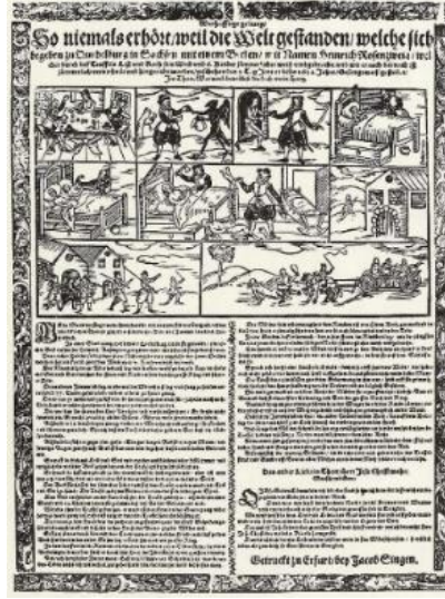
Görsel 1. Jacob Sing, Karısını ve Altı Çocuğunu Quedlinburg'ta Katleden Heinrich Rosenzweig'in Haberi, Saxony, 2 Ocak 1621. Ahşap baskı, 1621.

Görsel 1'deki afişte, bir cinayet eylemi ve bunun ardından katilin başına gelenler gösterilmektedir. Olay küçük resimlerle öyküleştirilmiştir.