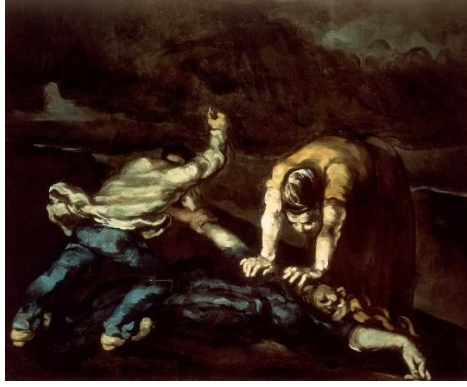
Görsel 5. Paul Cézanne, Cinayet, yak. 1870. Tuval üzerine yağlıboya. 65 x 80 cm.

Dokuz yaşında bir çocukken babasını bir düelloda kaybeden Jacques Louis David, belki de ölümle olan bu erken tanışmasının bir uzantısı olarak resimlerinde sık sık ölüm konusuna yer vermiştir. Seneca'nın Ölümü (1773), Sokrates'in Ölümü (1787), Marat'ın Öldürülmesi (1793) ve Bara'nın Ölümü (1794) bu tür resimler arasında sayılabilir. Devrimin sanatçısı olarak etkin bir şekilde çalışan David, arkadaşı Marat, genç bir kadın tarafından öldürüldükten sonra, aynı yıl içerisinde onu yücelten bir resim yapmıştır. Cildindeki rahatsızlık nedeniyle sık sık banyo yapması gereken Marat, çıplak bir şekilde küvetinde görülmektedir, "beyaz bir ipekli kumaşla örtülü başı omzuna düşmüştür ve dudaklarında bir çeşit hüzünlü gülümseme vardır; sarkan kolunun ucundan yere degen eli, yazı yazdığı kalemi hâlâ tutmaktadır; yerde ise cinayetin işlendiği bıçak durur" (Lefebvre, 2015, s.596). Sol elindeki kâğıtta kendisini öldüren Charlotte Corday'ın adı da okunmaktadır.