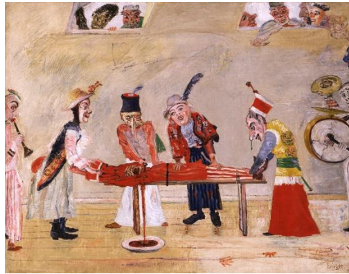
Görsel 6. James Ensor, Cinayet, 1890, Tuval üzerine yağlıboya, 60.5 x 77.2 cm.

bir saldırganlık ve acımasızlık egemendir. (...) Çoğu güçlü, koyu renklerle yapılmış resimlerde genellikle iki-üç kişi görülür. Kadın ya kurban ya baştan çıkarıcıdır. Cézanne resmedilen olayların acımasızlığını, figürlerin bedenlerini çarpıtarak ve buldukları ortamı baskı yaratacak ölçüde daraltarak vurgular. Güçlü ışık ve karanlık karşıtlığı duyguları şiddetlendirirken, gelişigüzel fırça darbeleri sahnenin heyecanını vurgular (Nonhoff, 2005, s.24, 25).