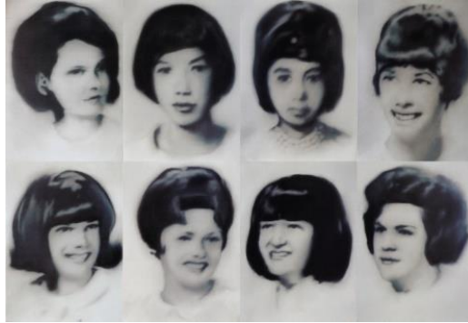
Görsel 11. Gerhard Richter, Sekiz Öğrenci Hemşire, 1966, Tuval üzerine yağlıboya, 8 parça, her biri: 95 cm x 70 cm.