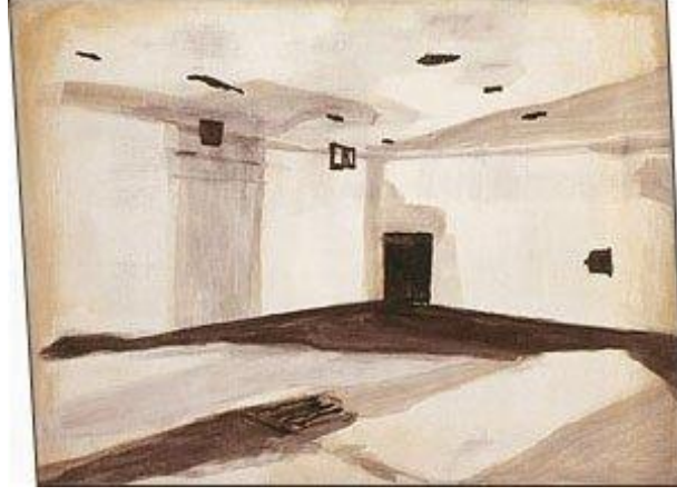
Görsel 12. Luc Tuymans, Gaz Odası, 1986, Tuval üzerine yağlıboya, 50 x 70 cm.

Luc Tuymans, belirsiz, soluk, yok oluyor izlenimi veren resimleriyle bilinen bir sanatçıdır. İlk bakışta çok da belli olmayan, bir iç mekânı gösteren bu resim “Mathausen toplama kampında, bir zamanlar çılgınlıkların doldurduğu, ölümün ufunetinin sindiği bir odanın resmiydi. (...) savaşların ve felaketlerin söylentisi. Tuymans tipik olarak cinayet sahnesini resmeder, cinayeti değil. Kimse orada değildir, ceset bile” (Godfrey, 2016, s.274).