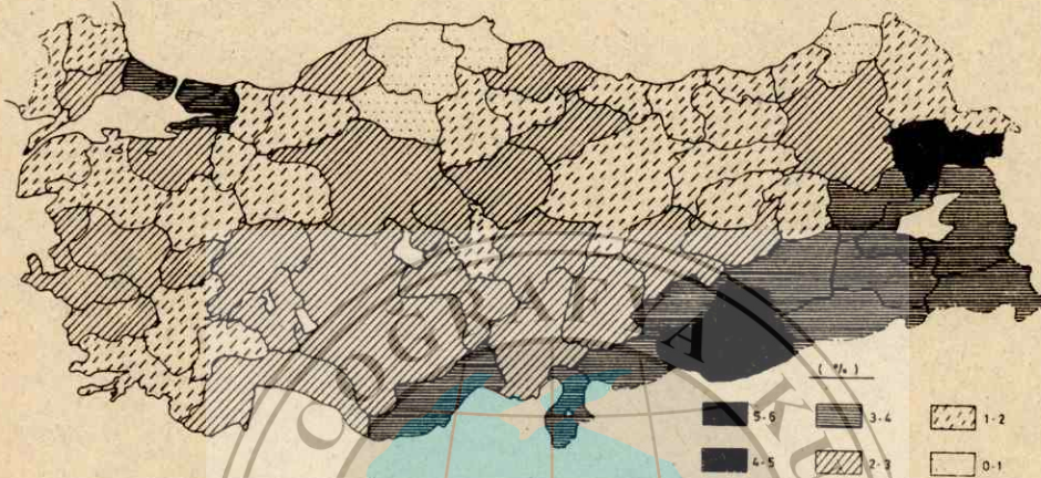
Şekil-3: 1980-1985 döneminde illerimizin doğal nüfus artış hızı bakımından dağılışı (%).

edilen illerimizin de yüksek doğal artışa sahip olmalarına neden olmuştur. İstanbul ve Kocaeli kadar çarpıcı olmamakla birlikte Ankara, İzmir ve Bursa da benzer özellikler gösteren illerimizdendir (Şekil-3).