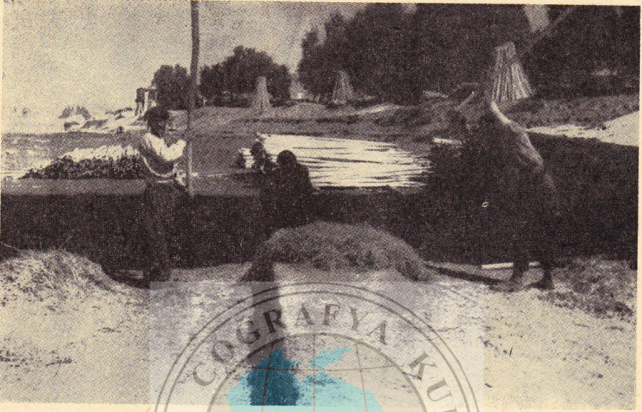
Resim: 4. Birecik Köprüsü altında kenevir lifinin dövülüşü (Foto: E. Kalelioğlu).