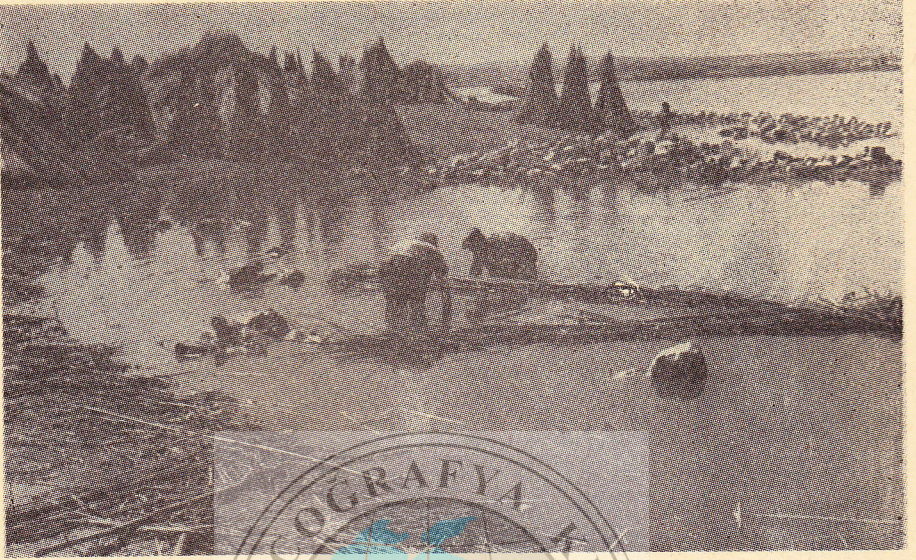
Resim: 2. Fırat Nehrinde kenevir demetlerinin ıslatılması ve arkada kenevir harmanları.