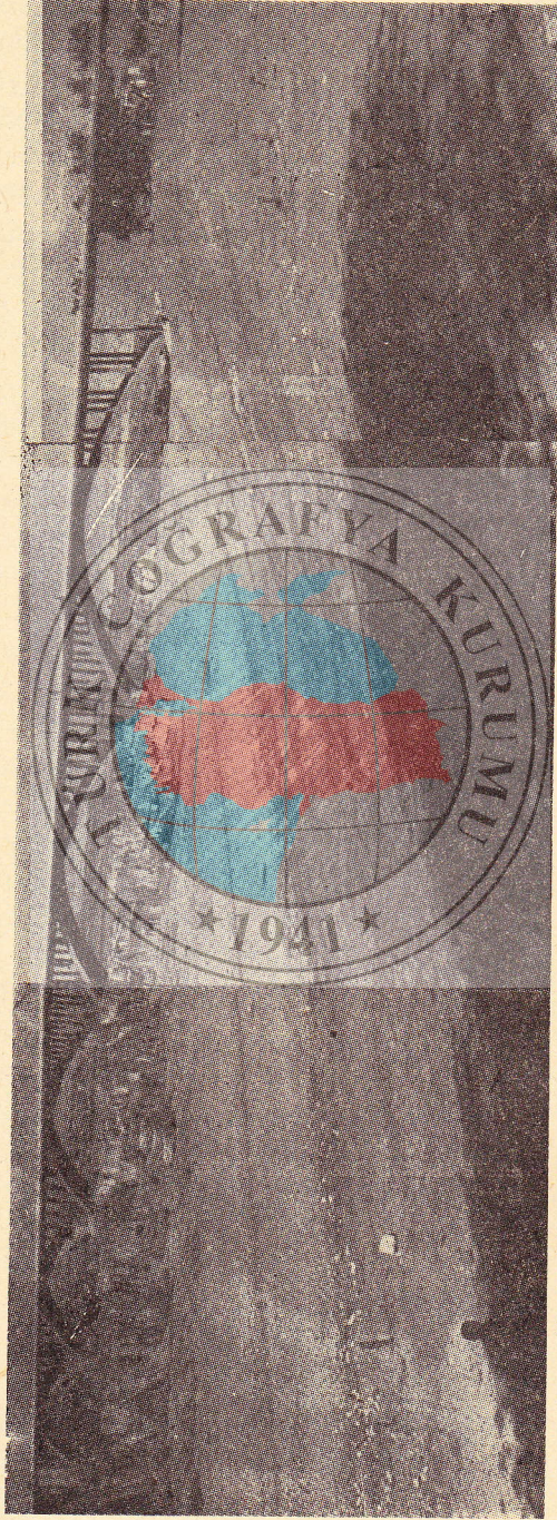
Resim: 1. Birecik Köprüsü ve Fırat Vâdisinde kendir harmanları (Foto: E. Kalelioğlu).