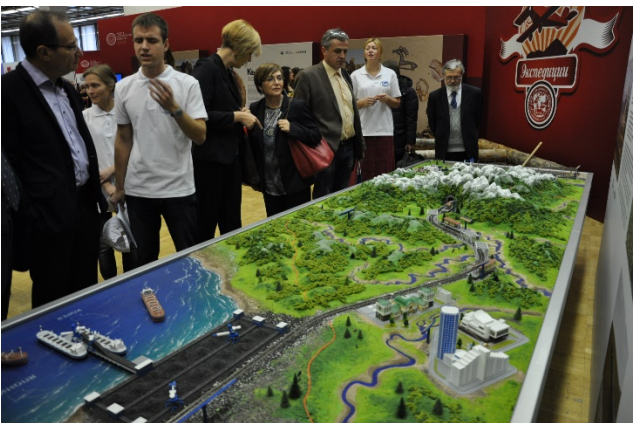
"1.Rusya Coğrafya Festivali"nden görüntüler (1 Kasım 2014, Moskova).