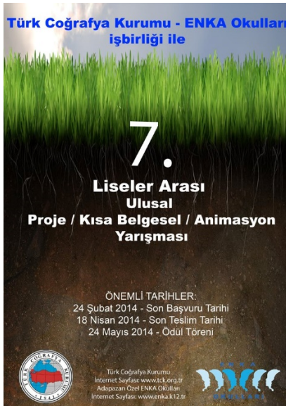
7. Liseler Arası Proje Yarışması afişi.