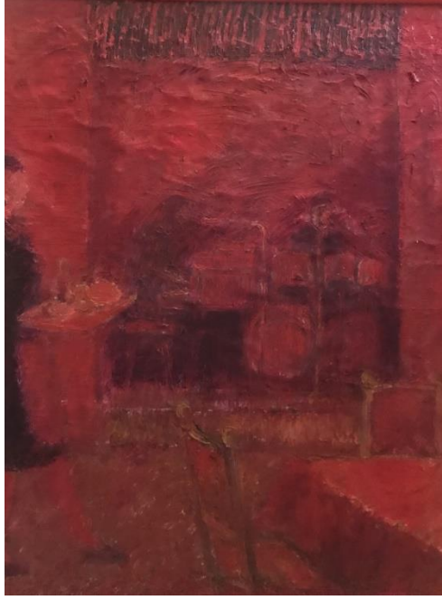
Resim 14. Kırmızı Kompozisyon 130x90 cm. karışık teknik, 2020