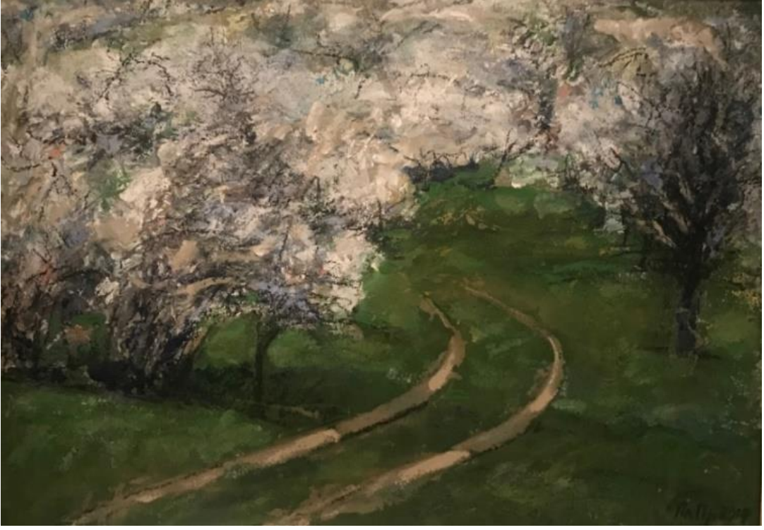
Resim 1: Plamen Prodanov, ilkbahar manzarası 80x110 cm yağlıboya (eski dönem çalışmalarından)

"Daha önce duyusal, görünebilir olan gerçekliği, doğayı tekrarlayan sanat, şimdi bu görevi bırakır ve bir başka varlığı, duyusal ve görünebilir olmayan bir varlığı görünür kılmak ister. Paul Klee'nin söylediği gibi: "Sanat, artık, görünebilir olan şeyi tekrarlamaz, tersine görünür kılar. Bu görünür kılınacak şey ise duyularla kavranan nesnelere değil ama onların anlamıdır ve nesnelere soyut düşünsel varlığıdır..." (Tunalı, 1996, 123).