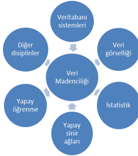
Şekil 1.1. Veri madenciliği ve disiplinler

Veri madenciliği araçları kullanılarak, işletmelerin daha etkin kararlar almasına yönelik karar destek sistemlerinde gerekli olan eğilimlerin ve davranış kalıplarının ortaya çıkarılması mümkün olmaktadır. Geçmişteki klasik karar destek sistemlerinin kullanıldığı araçlardan farklı olarak, veri madenciliğinde çok daha kapsamlı ve otomatize edilmiş analizler yapmaya yönelik, birçok farklı özellik bulunmaktadır (İnan, 2003).