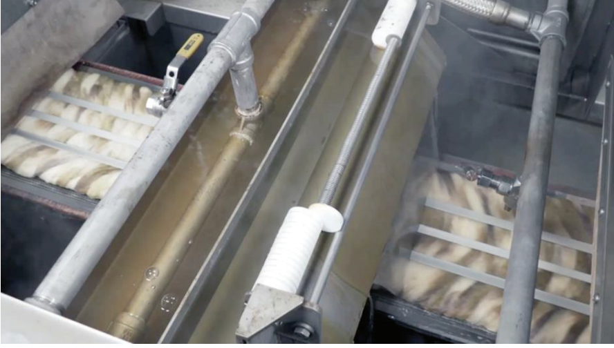
Şekil 1. İplik Demetlerinin Su Şelalesi Altından Geçiş

Geliştirilmesi istenilen makinede ise kurutulmak istenilen iplikler ilk önce bir hava emme ünitesi üzerinden geçirilerek üzerinden mümkün merteye su alınmaya çalışılmaktadır. Daha sonra bu iplikler, sıcak hava tüneline geçirilerek iplik üzerinde kalan su buharlaştırılarak atılmaya çalışılmaktadır. Özellikle, viskon gibi yüksek su emme özelliğine sahip iplik türlerinin bu yöntem ile kurutulması için oldukça uzun kurutma tünelleri kullanılmaktadır. Bu kurutma tünelleri, ısıtılan havanın kurutulmak istenilen ipliklerin üzerinde oluşturulan hava akımı ile iplik üzerindeki suyun buharlaştırılması amacıyla geliştirilmiştir. Bahsedilen kurutma tünellerinin ısıtılması için harcanan enerji bundan dolayı oldukça fazladır ve üretim maliyetini doğrudan olumsuz etkilemektedir. Bu kurutma tünellerinin uzunluğunun artması, doğru orantılı olarak ısıtma için ihtiyaç duyulan enerji miktarının ve dolayısıyla üretim maliyetinin de artmasına neden olmaktadır. Diğer taraftan, ıslak iplik üzerindeki suyun ısıtılarak buharlaştırılması için belirli bir süre gerekmektedir. Özellikle, yüksek su emiciliğine sahip ipliklerin istenilen nem değerine düşmesi için gereken süreyi sağlamak üretim hızını da belirlemektedir. Dolayısıyla etkili bir kurutma daha fazla üretim ve enerji tasarrufu anlamını taşımaktadır.