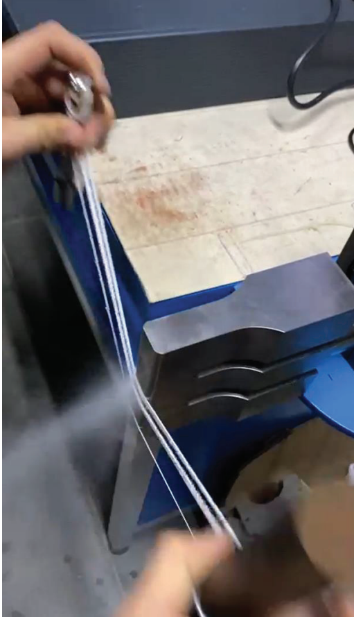
Şekil 3. Ultrasonik Kurutma Sisteminin Öncül Denemeleri

tarılmasını sağlamaktadır. Bahsedilen ultrasonik kurutma sistemine (100) ıslak ipliklerin (300) alındığı bölümde konumlandırılmış giriş avare silindiri (104), suyu atılmış ipliklerin (400) çıkış bölümde konumlandırılmış çıkış avare silindiri (105) ile birlikte çalışarak iplik demetinin gergin şekilde tutulmasını sağlayacaktır. Kavramsal tasarımın detaylandırılmasından daha sonra gerçekleştirilen sistemin prototip resmi Şekil 3'te görülmektedir. Ayrıca yine bu resimde bulutsu su taneleri net bir şekilde görülmektedir.