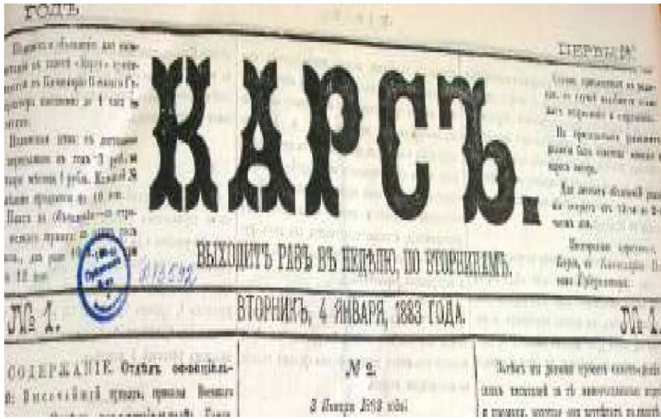
Vilayet Gazetesi Kars'ın 4 Ocak 1883 Tarihli İlk Sayısı