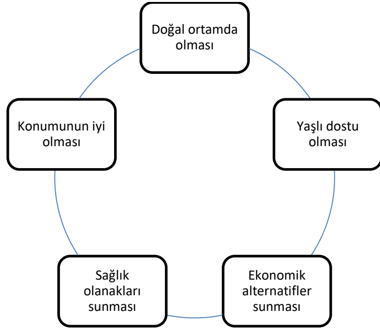
Şekil 2. Yaşlıların otel seçimlerinde aradıkları kriterler

Katılımcıların motivasyonlarının konaklamalarıyla ilgili yer seçimlerinin etkilediği görülmektedir. Katılımcılardan bazıları kalacakları yerlerde doğal çekiciklerin varlığını önemsemektedirler (Şekil 2).