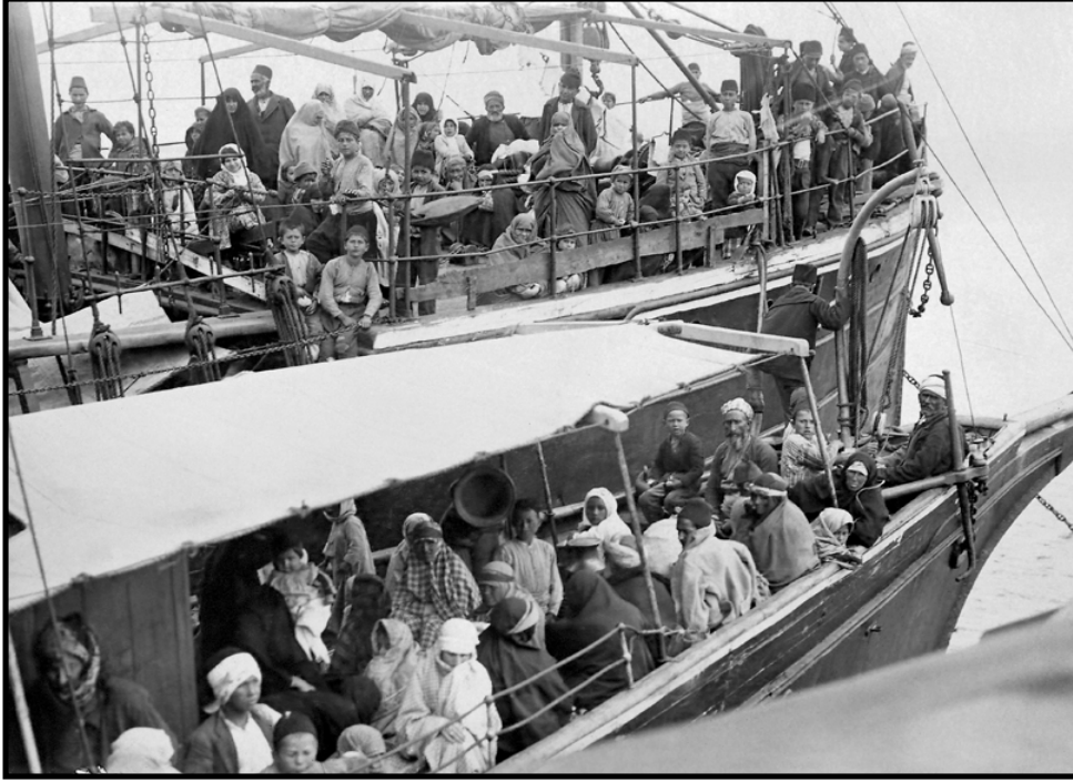
Fotoğraf 1: Yunanistan’da Yaşayan Türklerin Türkiye’ye İlticası (1925)