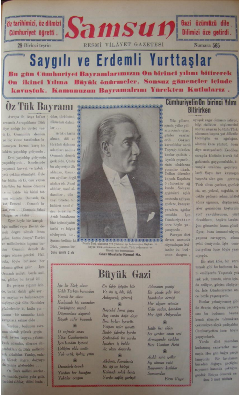
Resim 5: Samsun Gazetesi Cumhuriyetin On Birinci Yıldönümü Özel Sayısı