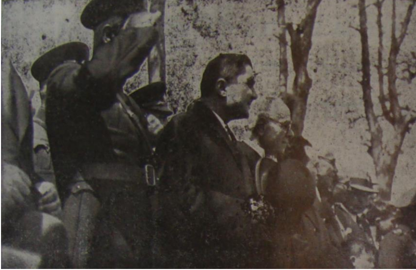
Resim 1: 29 Ekim 1938 yılı Cumhuriyet Bayramı Resmi Tören Alanı