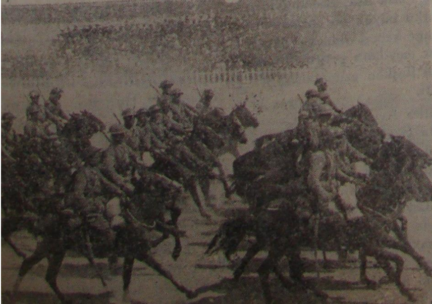
Resim 4: 1948 yılı Cumhuriyet Bayramı Geçit Resmi