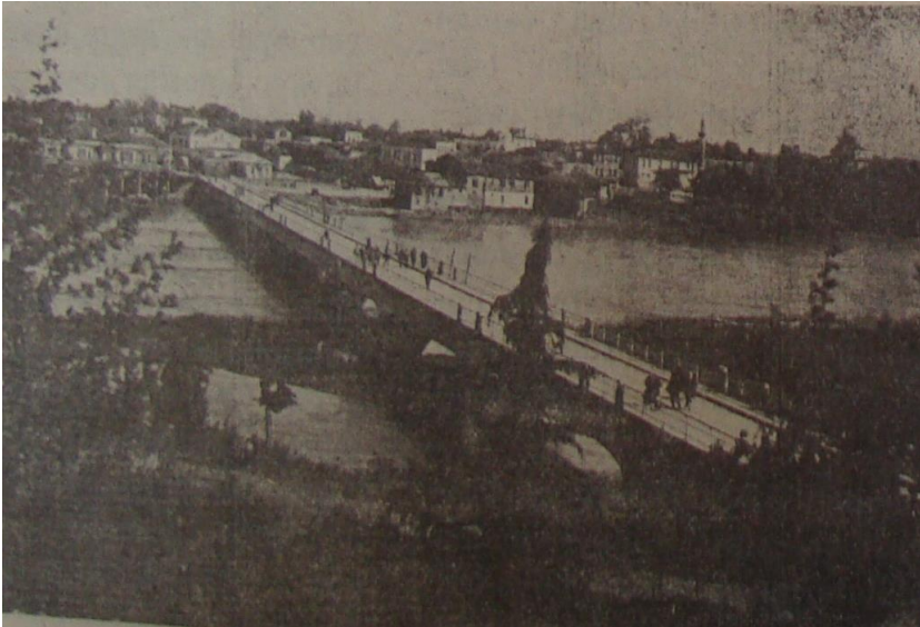
Resim 2: Cumhuriyetin eserlerinden Yeşilirmak Köprüsü