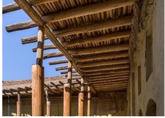
Görsel.19. Ahşap Tavan

Diğer taraftan evlerde daha az renkli camlar kullanılmıştır. 19 Sebebi ise güneş ışınlarının kuzeyden direkt olarak evlere vurmasıdır. 20 Bu evlerde sütunlar geniş yer kaplamış olup bu sütunlar daire, kare ve dikdörtgen şekilde inşa edilmiştir. Sütunların Osmanlı döneminde yapıldığı anlaşılmaktadır (Görsel.20).