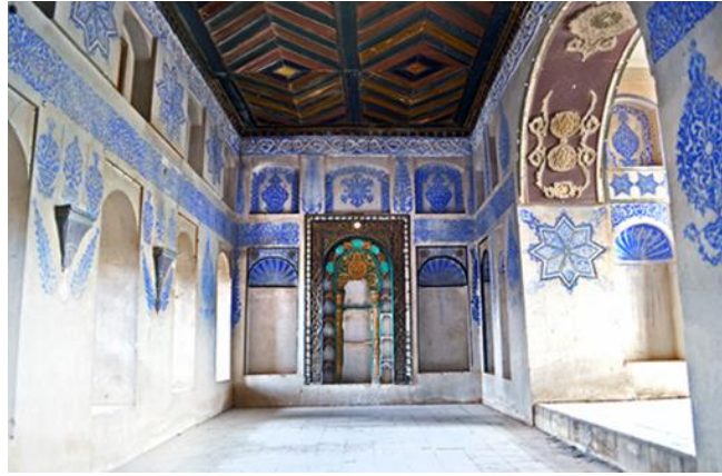
Görsel. 22. Evlerdeki Süslemeler