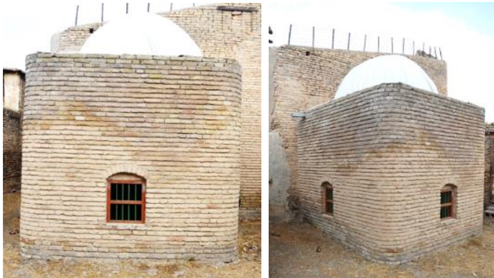
Görsel.13. Şeyh İbrahim Geylânî Türbesi

Türbe, Erbil Kalesi'ndeki Tekke mahallesinde, Şeyh Hızır'ın imarethanesinin yakınında ve Kaledeki ulu caminin karşısında yer almaktadır (Görsel 13). İçten ve dıştan kare planlı olan türbe, 4.10 x 4.10 m boyutlarına sahiptir. Yarım daire şeklinde bir kubbe ile üst örtüsü sağlanmıştır. Gövdenin her dört yönünde dikdörtgen şekli yarım daire kemerli pençeler bulunmaktadır. Boyut ve şekil olarak birbirine benzerlik göstermektedir. Türbenin tamamında kerpiç ve alçı malzemenin kullanıldığı anlaşılmaktadır.