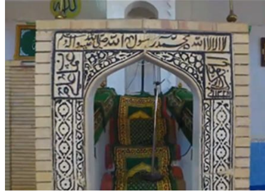
Görsel.11. Minberin Ayrıntısı