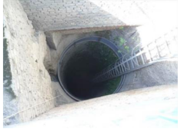
Görsel.8. Hamam Kuyusu (Bakır,2015, 21)