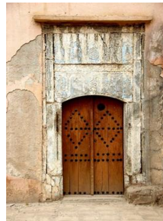
Görsel.6. Hamam Kapısı