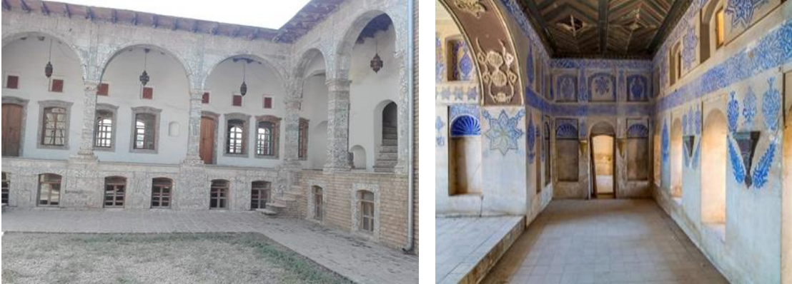
Görsel.16. Bodrum Katı