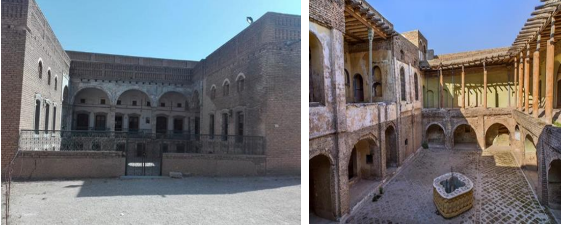
Görsel.15. Kaledeki İki Katlı Ev

ve malzemeler bunun en büyük kanıtıdır. 17 Şehrin ileri gelenlerinin evleri zemin ve üst kat olmak üzere iki kattan oluşmaktadır (Görsel 15). Ancak zemin katlar geniş bir avluya açılmaktadır (Görsel 16). Evlerin küçük pencereleri avluya bakmakta olup, bu pencereler sayesinde ışık ve hava akışına sağlanmaktadır. Ayrıca zemin kat üstüne bir de salon inşa edilmiştir (Görsel 17). Evlerde depo, mutfak ve barındırma odalarına giriş kapısından sonra yer verilerek dışardan hiç kimsenin bu odaları görmesine müsaade edilmezdi. 18