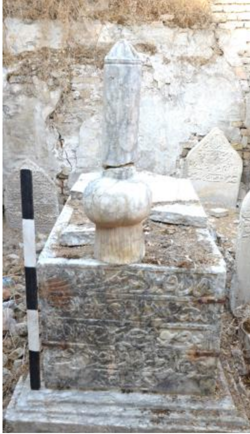
Görsel. 14. Şeyh Abid Sofi Mezarı

Sandukanın sol kısmında defnedilen kişinin bilgileri ve vefat tarihini içeren dört satır yazı bulunmaktadır. Sandukanın yan kısmında da düşey dikdörtgen sivri kemerli baş ve ayak şahideden oluşan bir adet mezar yer almaktadır. Maalesef mezar odası ve mezarlar tahrip edilmiş vaziyettedir.