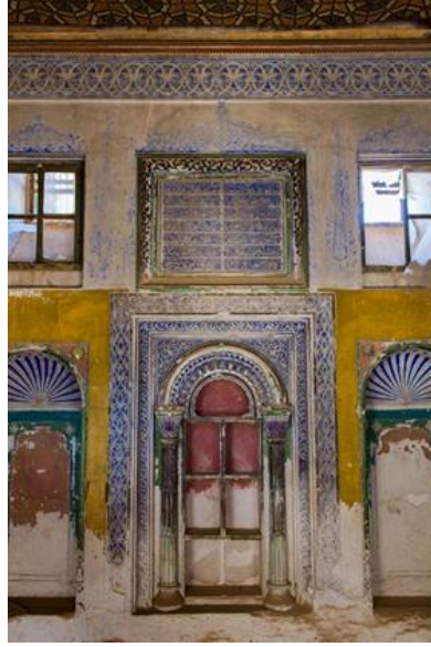
Görsel. 21. Evlerdeki Süslemeler