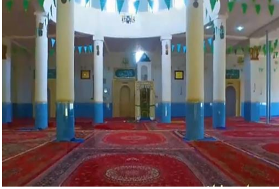
Görsel.10. Caminin İç kısmı

Osmanlı döneminde ise cami birkaç kez restore edilmiştir. Bağdat Valisi Necip Paşa, Erbil'i ziyareti esnasında caminin genişletmesini ve daha fazla önem verilmesini istemiştir. Bu istek üzerine yapı yeniden ele alınarak birçok değişiklikler yapılmıştır. Osmanlı döneminden günümüze kadar gelebilen minare ve minber bölümleri de bunun kanıtı olarak gösterilebilir. Minberin üzerindeki tarihe göre 1719 yılında yapıldığı ve minarenin ise (Görsel 10-12) 1785 yılında yapıldığı kitabelerden anlaşılmaktadır. Minber ve minarenin hemen hemen orijinal kimliklerini koruyarak günümüze kadar ulaştığını söylemek mümkündür. 15