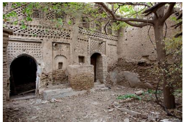
Görsel.23. Kaledeki Tek Katlı Evler