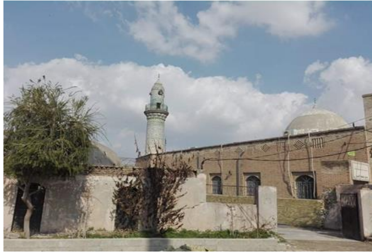
Görsel.9. Caminin Genel Görünüm

Kale cami, tek kubbeli kareye yakın dikdörtgen bir plan şemasına sahiptir. İbnü'l-Mustafî adlı ünlü Erbil tarihçisi Tarih'i Arbl adlı eserinde, yapıyı “kale mescidi” olarak da adlandırmıştır 13 (Görsel 9).