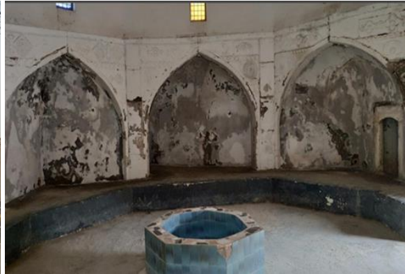
Görsel.4. Hamamın Yaz Bölümü