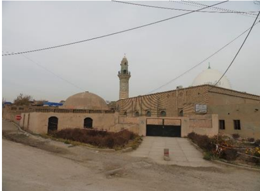
Görsel.3. Hamamın Genel Görünümü

Ilıklık kısmından ortası kubbeli sıcaklık bölümüne geçilmektedir. Dört yöne tonozlu eyvanlarla açılan sıcaklık kısmının köşelerinde ise halvet hücreleri yer almaktadır. Birinci eyvan giyinme, ikinci eyvan dinlenme ve giyinme, üçüncü eyvan yıkanmak gibi işlevlere sahip iken dördüncü eyvan ise daha serin olup, tek kişilik yıkanma odalarından oluşmaktadır. Halvet hücrelerinde ise dört ya da beş yıkanma yeri bulunmaktadır (Görsel 5). Sıcaklık kısmının ortasında Damat Taşı denilen bir taş yer almaktadır.