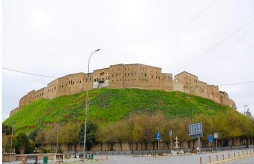
Görsel.2. Erbil Kalesinin Dış Görünüşü

Geniş bir alana yayılan kalenin içerisinde çok sayıda ev, cami, hamam ve çarşı bulunmaktadır 8 (Görsel 2). Pek çok evin süsleme unsurları, renkleri ve güzel bezemeleri ile ziyaretçilerin dikkatini çekecek bir görünüme sahiptirler. Kale, değişik tasarım ve dekorları olan evlerin yanı sıra, ayrıca üç tarihi müze, el sanatları merkezi ve diğer bileşenleri içermektedir. 9