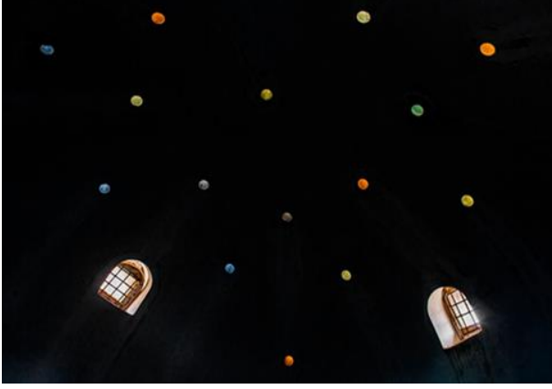
Görsel.7. Pencere ve Küçük Boşluklar

Bu taşa damat taşı denmesinin nedeni ise evlenmeden önceki gün Damat'ın arkadaşlarıyla hamama giderek bu taş üstünde arkadaşları tarafından yıkanılmasıdır 11 (Görsel 5). Hamamın ışıklandırılması ve hava akışını sağlamak için kubbe ve tavanlarda pencere ve küçük boşluklara yer verilmiştir (Görsel.7). Ayrıca kuzey tarafında 5 m çapında ve 45 m derinliğinde özel bir kuyusu mevcuttur 12 (Görsel 8).