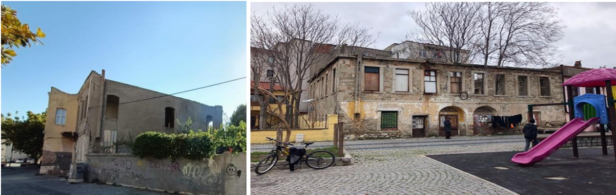
Şekil 3. Meydanın merkezindeki kullanım dışı harabe halindeki tarihi yapılar (Orijinal, 2020-21).

Meydana farklı noktalardan girişin bulunması ve sahile uzanan aks içinde olması önemini daha da artırmaktadır. Ancak günümüzde meydan çevresinde terk edilmiş, harabe halinde, bazı yapıların varlığı en önemli sorundur. Bu durum alanda güvenlik açısından önemli risk oluşturmakta ve görsel kirlilik yaratmaktadır. Aynı zamanda tarihi doku ile uyumlu olmayan bakımsız konutlar da vardır. Alanda Çanakkale Belediyesi tarafından yapısal ve bitkisel peyzaj düzenlemesi 2013 yılında yapılmıştır. Alanda oyun ünitesi, donatı elemanları, bitkisel düzenlemeler ve yer döşemesi yapılmıştır. Ancak bu çalışma ile alanın rekreasyonel olarak kullanımı iyileştirilememiştir. Günümüz şartlarında alanın sağlıklı olarak kullanımının sağlanabilmesi için yeniden ele alınması zorunludur. Alanın estetik görünümünü bozan yapıların günümüz ihtiyaçlarına göre kullanımı için kamulaştırılıp, sağlıklılaştırılması veya sahiplerinin desteklenmesi zorunludur. Meydanın kamusal rekreasyon alanı olarak kullanımının daha konforlu olabilmesi için ise özel mekanlardan maskelenmesi gereklidir. Girişi direk meydana olan konutlara bariyerler veya bitkisel çözümler getirilebilir (Şekil 3).