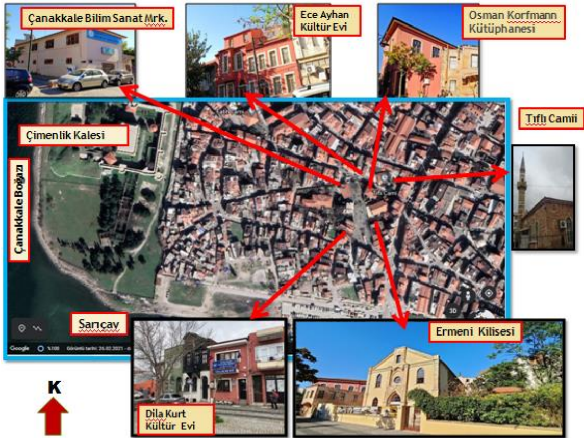
Şekil 2. Meydanda yer alan kullanımlar (2021)

Zafer Meydanı kentsel sit alanı sınırları içerisinde yer almakta olup, kentin çok kültürlü kimliğini yansıtmaktadır. Çünkü meydanda kentin tarihine tanıklık etmiş önemli yapılar bulunmaktadır: Eski Ermeni Kilisesi (Surb Kevor Kilisesi), Tıflı Camii, Manfred Osman Korfmann Kütüphanesi, Ece Ayhan Kültür Evi, Çağdaş Yaşamı Destekleme Derneği Dila Kurt Evi ve Milli Eğitim Bakanlığı Çanakkale Bilim ve Sanat Merkezi. Bunlar alan haritası üzerinde gösterilmiştir (Şekil 2).