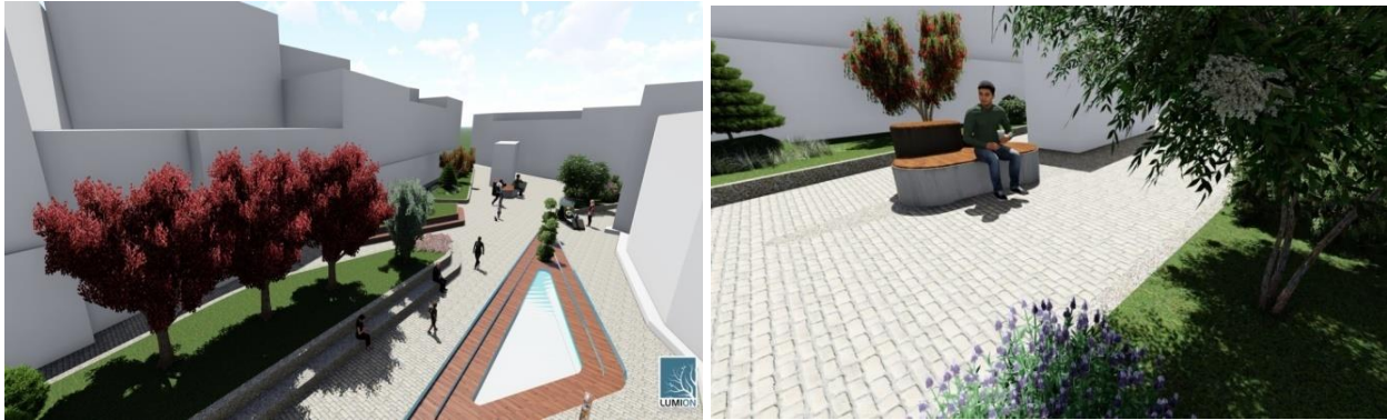
Şekil 7. Oturma alanları ve zemin kaplaması

Meydanda kullanıcıların dinlenme ve bir araya gelme ihtiyaçlarını karşılamak için farklı oturma alanlarına yer verilmiştir. Alanın zemininde hareketlilik yapılarak renklendirilmiş ve oturma alanı olarak kullanılmıştır. Böylece hem hareketlilik sağlanmış, hem de çevre yapılarından oturma mekanı gizlenmiştir (Şekil 7).