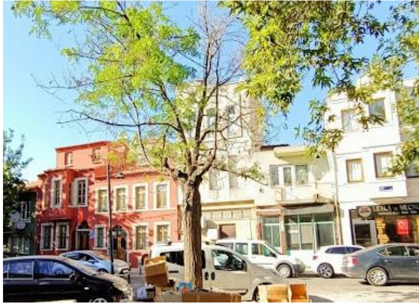
Şekil 4. Meydanda Ece Ayhan Kültür Evine doğru görünüş (Orijinal, 2021)