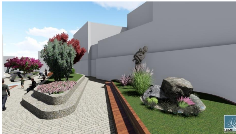
Şekil 8. Oturma alanında anne temalı heykel

Alanda minyatür bir kaya bahçesine yer verilmiş ve odak nokta etkisi yaratması açısından anne temalı heykel tasarımı yapılmıştır (Şekil 8).