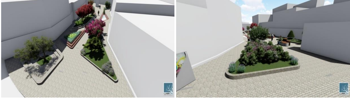
Şekil 6. Alana Tıflı Sokak ve İnönü Caddesinden giriş

Meydanın her iki girişinden alınan üç boyutlu görsellerde yapısal ve bitkisel tasarımlar detaylı olarak verilmiştir (Şekil 6).