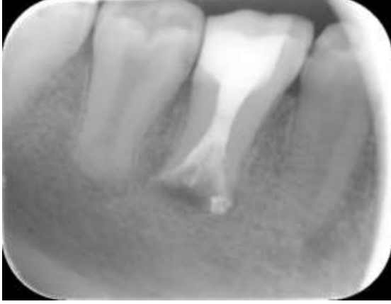
Şekil 3. Tedavi sonrası alt sağ birinci molar dişin radyografik görüntüsü

oranlardan, %11.3 gibi daha yüksek oranlara ulaştığını göstermiştir (15, 16). Türk toplumunda ise cinsiyet farkı olmaksızın %4.97 ile %7.4 oranında taurodont dişlere rastlanmıştır (9, 10). Türk toplumunda yüksek sayılabilecek oranlarda görülebilen bu yapıdaki dişlerin klinik olarak belirlenmesi oldukça zordur. Klinikte sadece mine-sement birleşim yerindeki daralma bu dişlerde daha az belirgin ya da yok olmasıyla karakterizedir (3). Bundan dolayı kesin teşhis sadece alınacak olan radyografilerle konulabilir (17).