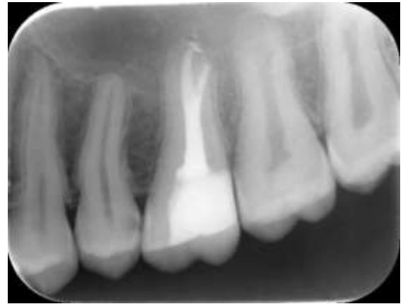
Şekil 2. Tedavi sonrası üst sol birinci molar dişin radyografik görüntüsü

Tedavi bitiminden 3 ay sonra hasta ilk kontrole çağrıldı. Yapılan klinik ve radyografik muayenede her iki dişin klinik olarak asemptomatik olduğu, radyografik olarak ise periapikal lezyonun iyileşme eğiliminde olduğu görüldü (Şekil 2 ve 3).