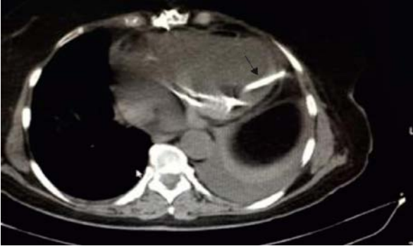
Şekil 2. Kompüterize tomografide kateterin sol ventrikülde olduğu görülmekte. (Siyah ok)