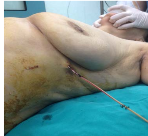
Resim 1. Pleurocan kateter takılma yeri

adet göğüs dreni konularak katlar usulüne uygun kapatıldı. Postoperatif 7. gün hasta taburcu edildi.