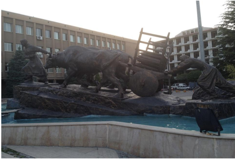
Resim 3. Kağrı Arabası Çeken Kadınlar Heykeli