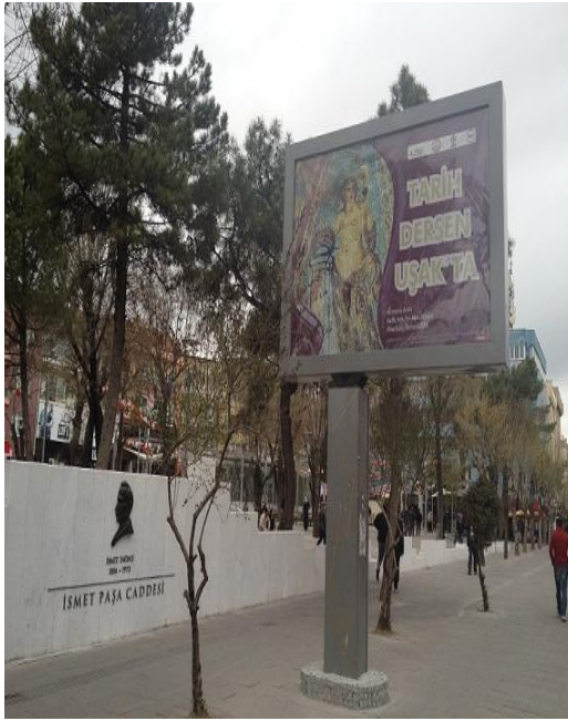
Resim 5. Uşak/Banaz/Ahat Köyü'nde yer alan Akmonia antik kentinden çıkarılan Şans Tanrıçası Tike mozaiğini betimleyen billboard

İsmet Paşa Caddesi'nin girişinde billboardda "Tarih Dersen UŞAK'TA" adlı projenin tanıtımı, kadın bedenini kutsayan bir antik dönem mozaiği resmi -Şans Tanrıçası Tike- ön planda tutulmuştur. Bu resim, ülke genelinde artan muhafazakâr hassasiyete rağmen uzun zamandır şehrin ana caddesinin girişini süslemektedir. Caddenin başındaki Tiritöğlü parkına yapılan süs duvarına ilâştirilen İsmet İnönü rölyefi kentin ana caddesinin isminin eril karakterini görselleştirmektedir.