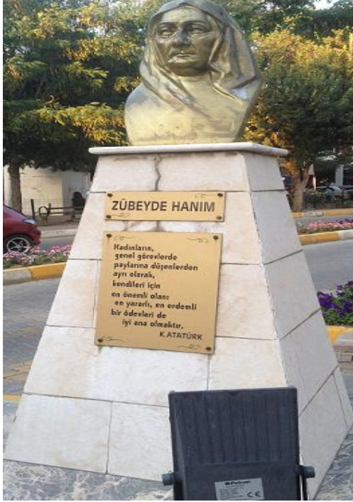
Resim 12. Zübeyde Hanım Büstü

Uşak şehrinde Atatürk'ün annesi Zübeyde Hanım'ın hem adının verildiği bir cadde, hem de büstünün bulunmasına rağmen; Uşak kızadelerinkızı olan Latife Hanım'ın bu derece onurlandırılmaması ilginçtir. Şehrin kamusal alanındaki hatırası, Latife Hanım Uşaklı bir ailenin kızı olmasına rağmen, ülkenin siyasi tarihindeki ağırlığına oranla çok zayıf bir şekilde temsil edilmektedir. Bu durum daha önce Uşak yerel basınında da dile getirilmiştir. 1998 yılında yazılan bir yazıda şöyle denilmektedir. "Ulu Önder Atatürk'ten hep Uşakımızın eniştesi diye söz ederiz, övünürüz. Ama kendi kızımızdan hiç bahsetmeyiz. Latife Hanımın ismi neden bir okula yahut benzeri bir yerlere verilmez anlamıyorum (Keyvanoğlu, 1998). Keyvanoğlu, yazısının devamında yeni yapılacak olan Kültür Sitesi'ne Latife Hanım'ın adının verilmesini teklif etmiştir. Ama bu teklif sadece bir öneri olarak kalmıştır. Hâlihazırda Uşak'ta Milli Eğitim Müdürlüğü'ne bağlı bir anaokuluna ve Uşak Üniversitesinin amfilerinden birine Latife Hanım'ın adı verilmiştir. İşin ilginç tarafı, Latife Hanım'ın doğup büyüdüğü İzmir'deki Uşakizade Konağı da İsmet Paşa Caddesi ile Mithat Paşa Caddesi arasındadır. Görüldüğü üzere, Latife Hanım'ın adı hem köklerinin