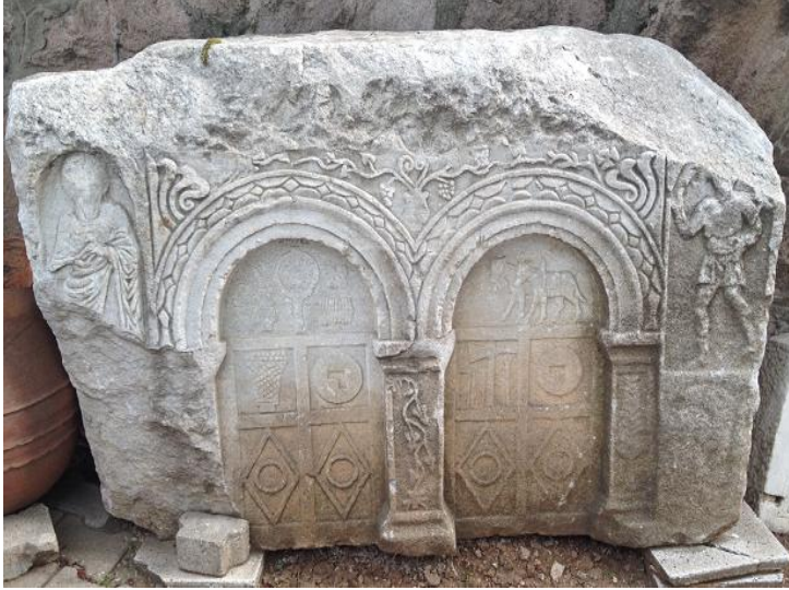
Resim 13. Bir mezar steli örneği.

Son durağımız Uşak Müzesi oldu. Roma dönemine ait aile mezarı stellerinde kadınlar eşleriyle beraber tasvir edilmişti. Ayrıca karı kocanın meslek ve sosyal statülerine ait bilgi verici değişik kabartmalar da eşit kompozisyonlar halinde mezar taşlarının üzerine yerleştirilmişti. Bu durum aynı zamanda kadın ve erkeğin pagan Roma toplumundaki görece eşit statüsünü de göstermektedir. Alttaki stelde, erkeğe ayrılan sol tarafta çifte koşulan hayvanlar, değirmen ve kazma kabartmaları görülürken, kadına ait bölümde ise ayna, değirmen ve sepet görülmektedir.