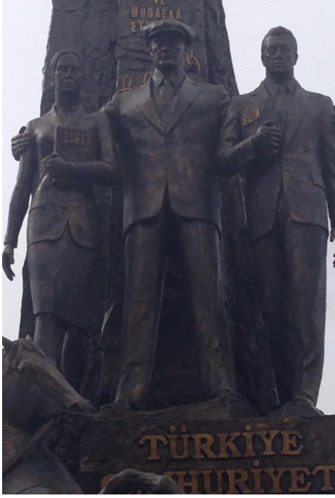
Resim 1. Atatürk ve Kurtuluş Anıtı/ Şehir Meydanı Heykeli