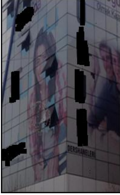
Resim 11. Bir dersane reklamı görseli

Benzer bir duruma bir dersane binasına giydirilmiş tanıtımında da görmek mümkündür. Dershane binasının camekânlaştırılmış ön ve yan duvarında kadın ve erkek öğrenciler bulunmaktadır. Kadın öğrencinin görseli ana caddeye bakmaktayken, erkek öğrenci görseli yan caddeye konulmak suretiyle ikincilleştirilmiştir.