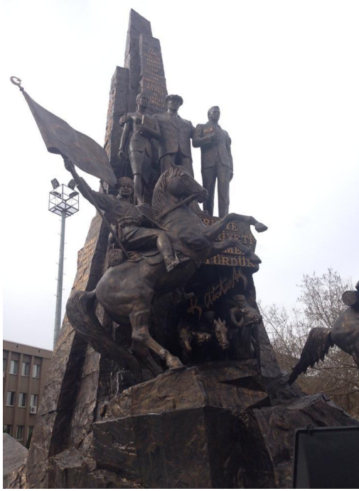
Resim 2. Şehir Meydanı Heykelinin Yükselen Sütunu

Meydan Heykelini incelediğimizde ön taraftaki sütunun üzerinde yer alan üçlü figür göze çarpmaktadır. Bu figürde Atatürk, sağında bir kadın ve solunda bir erkekle temsil edilmektedir. Kadının sol elinde sanat isimli bir kitap, erkeğin ise sağ elinde bilim isimli bir diğer kitap vardır. Kadının elindeki kitabın sol elinde bulunması, kalbine yakınlığı gözetilmiş ve kitabın isminin sanat olması sanatın ve duygu ile ilgili şeylerin kadına atfedilmesi, erkeğin sağ elinde bilim isimli kitabın olması ise erkeğin bilek gücü ve bilimle ilişkilendirilmesi anlamına gelebilir. Fine'a göre, erkek bilim, matematik, kariyer, hiyerarşi ve yüksek otoriteye ilişkin çağrışımlara; kadın ise insani bilimler, aile, eşitlikçilik ve alt seviye otoriteye dair çağrışımlara sahiptir (Fine, 2011: 29). İncelediğimiz heykeli kentin meydanına diken idarenin bilerek yahut bilmeyerek toplumsal cinsiyet kalıplarını yeniden üreten bir söylem ortaya koyduğunu söylemek mümkündür.