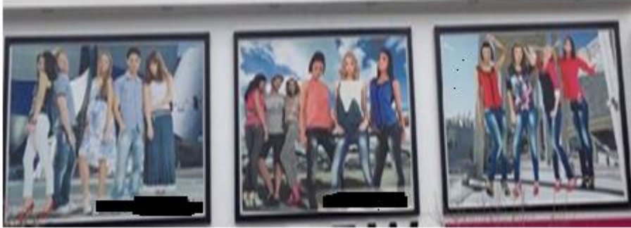
Resim 8. Gençlere yönelik ürün satan bir giyim mağazasının tabelası

Başka bir giyim mağazası reklam panosunda da, kadın imgesi yine ön plandadır. Metalaştırılan kadın bedeni, reklam unsuru haline getirilerek ticarileştirilmiştir. Ticarileştirilen bu bedenin, bir arzu nesnesi olması için ekstra çabalara girişilmiştir. Panonun ön planındaki kadınların bedenleri – neredeyse sıfır beden- ve ayakkabıları -genellikle topuklu kırmızı ayakkabılar- dikkat çekicidir. Baudrillard'ın (2008: 167) da belirttiği üzere, “güzellik ve erotizm birbirinden ayrılmaz ve ikisi birden bedene ilişkin yeni etiği oluştur”maktadır. Çünkü (Baudrillard, 2008: 172), beden sattırır, güzellik sattırır, erotizm sattırır.