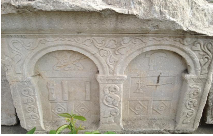
Resim 14. Bir mezar steli örneği

Kimi steller de kadın ve erkeğe ait kabartmalar yoktur, sadece kadın ve erkeği gösteren eşyalara ait kabartmalar vardır.