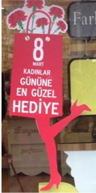
Resim 6. Bir parfüm mağazasının camekânındaki reklam görseli

bir gün önce; bir taşra şehri olan Uşak'ta kadın imajının nasıl metalaştırıldığına dair ülke çapındaki örneklerle de büyük ölçüde benzeşen ilginç imajlarla karşılaşıldı. Bu bağlamda, bir parfüm şirketinin camekânında rastlanılan aşağıdaki görselde kadın vücudunun bir kısmı - bacaklar gibi nispeten daha çekici olduğu kabul edilen bir bölümü- satılması arzulan mallarla beraber tasvir edilmektedir. Kullanılan kadın bacağı imgesinin sıfır bedene gönderme yapması, tüketim toplumunun önemli öğelerinden olan reklamların (Altınel, 2004: 14) kadın bedenini sadece ticari amaçları doğrultusunda kullanmadığını, aynı zamanda ülküsel kadın modellerini de oluşturup topluma empoze ettiği savını güçlendirmektedir. Çubuklu'ya (2004: 118) göre, cinsellik seyirlik bir tüketim malzemesi haline gelmiştir. Kadın, bedeni ve giysisiyle, nesneleştirici erkek bakışının yöneldiği, pasif bir varlığa dönüştürülmektedir. Moda, uysal toplumsal bedenler üretmeye çalışan modernliğin giyimsel disiplin aracı olmaktadır.