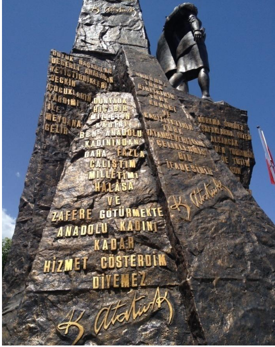
Resim 4. Şehir Meydanı Heykeli'nin Kadın ile İlgili Vecizelerinin Olduğu Kısmı