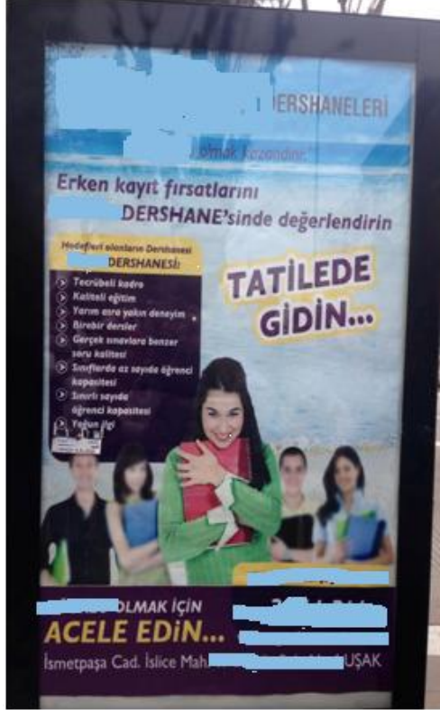
Resim 9. Bir dersane reklamının görseli

namus kavramına vurgu yapıldığını düşündürmektedir. Tüketim kültürü, nabza göre şerbet verme sanatında mahirdir. Bu bağlamda, daha çok mal ve ürün satmak adına, kadın kendisine yüklenilebilecek tüm anlam dünyaları çerçevesinde –bunların birbirine zıt anlam dünyalarına gönderme yapmasının pek de önemi yoktur- kamusal pazarda temsil edilmektedir.