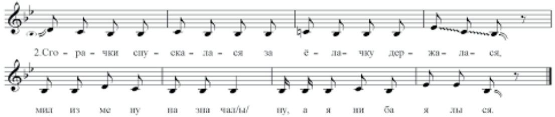
Nota 3. Rus çastuşkası. Nota yazısı Rahimova, 2020.

Мы частушек много знаем И хороших, и плохих. Интересно тем послушать,