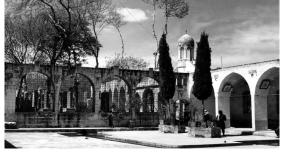
Resim 3. Mevlûd-i Halilür-Rahman Külliyesi

herhangi bilgi mevcut değildir. Ancak bu kitapların bugün dahi bir kısmı Mevlûd-i Halilürrahman Camii'nin ziyaret girişi yanındaki bir odada sergilendiği bilinmektedir (Tenik 2002; 108).