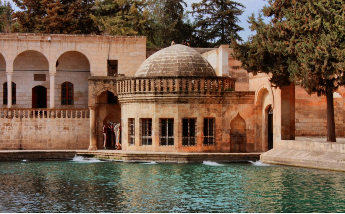
Resim 2. Ayn-ı Halilürrahman Zaviyesi'ne ait şeyh odası

edilen bu odaya konulmuş olduğu ve buranın bir kütüphane mahiyetine geldiğini söyleyebiliriz.