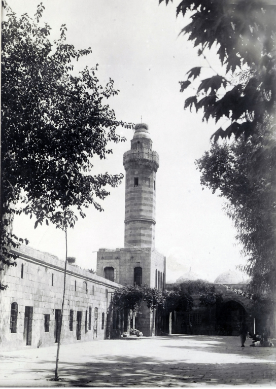
Resim 3. Mevlûd-i Halilü'r-Rahman Külliyesi

belirtilen diğer üç vakıftan farklı olarak tasarruf hakkı ile ilgili olarak vakıf kurucularının “ daha iyi bilen ve günah işlemekten korkan ” nesilden nesile erkek evlatlarına inkırazında ise aynı vasıflara sahip akrabalarına ve bunların dahi inkırazında bu kitapların Hameyn-i Ş-Şerifeyn kütüphanelerine konulmasını şart koştukları anlaşılmaktadır. Yani bu kitapların istifadesi öncelikle kendi nesillerine bırakılmış olup, nesillerinin inkırazında ise kitapların şehirde bırakılmaması ve Hameyn-i Ş-Şerifeyn kütüphanelerine gönderilmesi şart konulmuştur. Bu şartların dikkat çekici tarafı vakfedilenin menkul ve gayrimenkul olmamasına